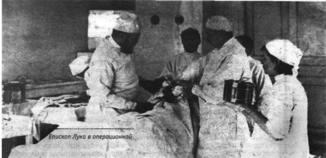
Епископ Лука в операционной

в Енисейск, затем в Туруханск и, наконец, в деревню Плахино, лежавшую в 230 километрах за Полярным кругом. В поездке он так ослаб и заоченел, что его «на руках внесли в избу и там долго отогревали» («Автобиография»). В конце ноября 1925 года в Туруханск, куда его вернули, пришло, наконец, постановление об освобождении гражданина Войно-Ясенецкого.