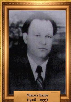
Мікола Засім (1908 – 1957)