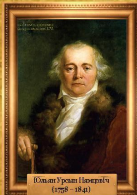
Юльян Урсын Нямцэвіч (1758 – 1841)