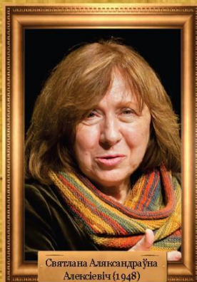
Святлана Аляксандраўна Алексевіч (1948)