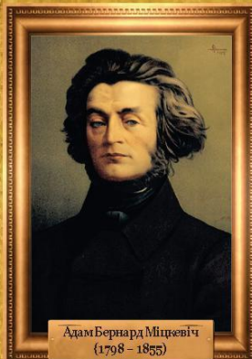
Адам Бернард Міцкевіч (1798 – 1855)