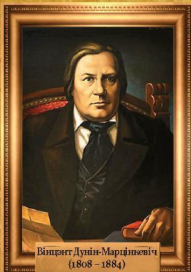
Вінцэнт Дунін-Марцінкевіч (1808 – 1884)