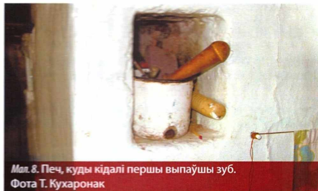
Мал. 8. Печ, куды кідалі першы выпайшы зуб.

Хрэсьбіны на большай частцы тэрыторыі Беларусі (за выключэннем Заходняга Палесся) завяршаў спецыяльны абрад пад назвай «цягаць бабку на баране» (мал. 7). Госці выходзілі на двор, рыхтавалі санкі ці калёсы, на якія клалі зуб'ём уніз барану, засланую кажухом (у больш раннія часы выкарыстоўвалася толькі барана, пакрытая кажухом), садзілі бабку і везлі яе да карчмы або да хаты. Часам бабку ўпрыгожвалі каснікамі, пер'ем, у рукі давалі дубец, венік або чырвоную стужку. Госці пераапрапаналіся ў карнавальныя касцюмы «доктара», «салдата», жанчыны ў мужчынскае адзенне і наадварот, многія на галаву надзявалі рэшата, вымазвалі сабе твар сажай, ідучы па вуліцы, спявалі, крычалі, пляскалі ў далоні, стукалі палкамі ці качалкамі ў пустыя