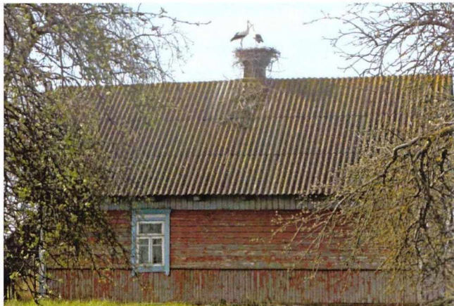
Мал. 2. Буслы, што прыносяць дзяцей.

У традыцыйнай культуры дародавыя забароны і рэкамендацыі былі заснаваны галоўным чынам