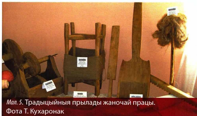
Мал. 5. Традыцыйныя прылады жаночай працы.