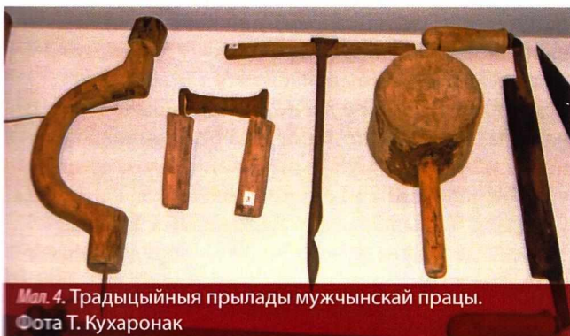
Мал. 4. Традыцыйныя прылады мужчынскай працы.

Спалі немаўлята ў люльках або калысках. Калыска была адна на ўсіх дзяцей, каб браты і сёстры сябравалі паміж сабой. Да яе адносіліся як да святой рэчы ў хаце (мал. 6).