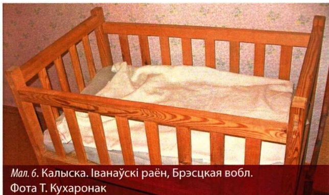
Мал. 6. Калыска. Іванаўскі раён, Брэсцкая вобл.

Беларусы верылі, што ў тую хвіліну, як нараджаўся чалавек, ён атрымліваў сваю долю, а на небе загаралася новая зорка. Бачным знакам шчаслівага лёсу была так званая дзіцячая сарочка, гэта значыць перапонка на галаве, з якой нараджалася немаўля. Лічылася, што шчасце і дабрабыт не пакінуць такога чалавека ўсё яго жыццё, адсюль выраз: «нарадзіўся ў сарочцы/рубашцы». У панядзелак, паводле народных уяўленняў, з'яўляліся на свет няўмекі, у якіх усё з рук валілася. Беларусы былі перакананы, што чалавек, які нарадзіўся ў аўторак, пражыве доўгае і шчаслівае жыццё, будзе мець шанцаванне ў вытворчых справах. Тых, чый дзень нараджэння прыпадаў на сераду, чакаў неакрэслены лёс («ні тое, ні сёе»). Меркавалася, што дзіця, якое з'явілася ў чацвер, будзе вельмі працавітым, яно рана пачынала хадзіць, гаварыць, праяўляла кемлівасць і спрыт ва ўсіх справах. У некаторых лакальных традыцыях чацвер лічыўся самым шчаслівым днём для нараджэння хлопчыка. Пятніца прыносіла бацькам лайдакоў, злодзеяў і горкіх п'яніц, і, наогул, значылася нешчаслівым днём для нараджэння. Тыя дзеці, што нарадзіліся