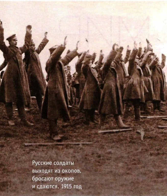
Русские солдаты выходят из окопов, бросают оружие и сдаются. 1915 год

ве с контр-адмиралом Василием Михайловичем Альтфатером, внешне похожим на Николая II, из-за чего случались даже забавные конфузы. Местный православный батюшка, например, решил, что в переговорах тайно участвует бывший император.