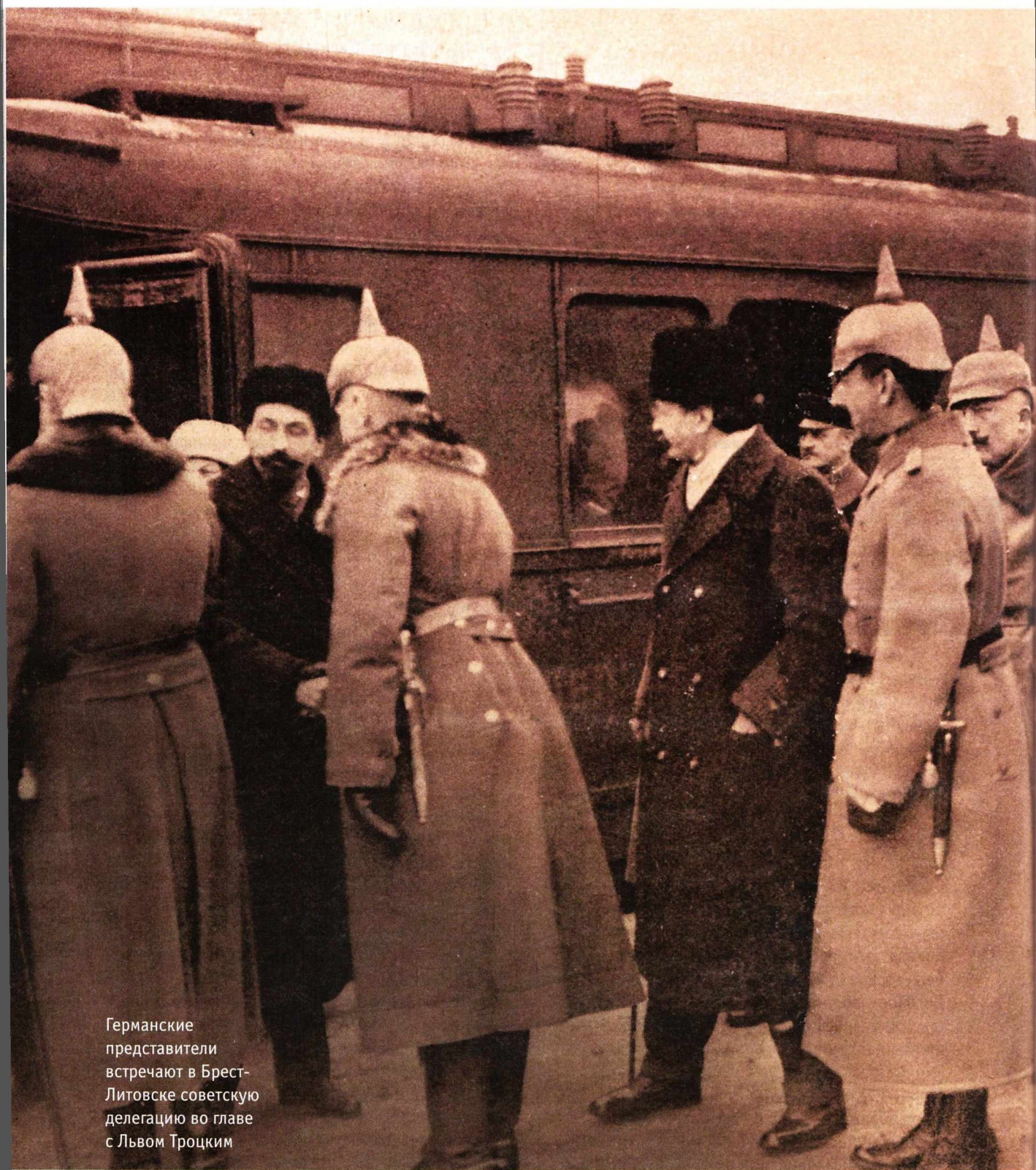
Германские представители встречают в Брест-Литовске советскую делегацию во главе с Львом Троцким