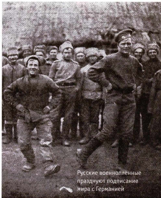
Русские военнопленные празднуют подписание мира с Германией