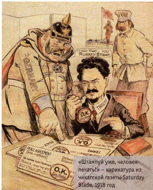
«Штампуй уже, человек-печать!» – карикатура из чикагской газеты Saturday Blade, 1918 год

Но на этот раз советская делегация подписала мирный договор, как образно выразился Троцкий, «не читая». Брестская революционная авантюра была закончена. Большевиков принудили подписать «аннексионистский» мир. Правда, условия Брестского мира просуществовали недолго – в ноябре 1918 года они были отменены Компьенским перемирием на Западе. А летом 1919 года в Париже Антанта окончательно раскромсала Германию. 🌐