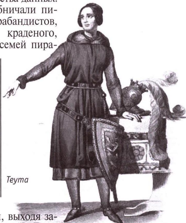
Жанна де Клиссон

тов. Некоторые женщины, выходя замуж за пиратов, превращали свои дома или заведения в пиратские убежища. Некоторые влиятельные женщины, в том числе монархи, такие как Елизавета I Английская, также выступали в качестве могущественных покровителей пиратов.