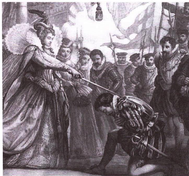
Елизавета I посвящает Френсиса Дрейка в рыцари