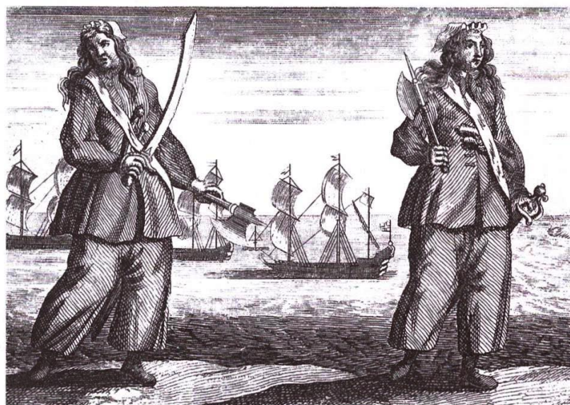
Энн Бонни и Мэри Рид

из-за женщин. Многие известные женщины-пираты, такие как Энн Бонни (1697—1782) и Мэри Рид (1685—1721), одевались и действовали как мужчины, и, по всей видимости, не ассоциировали себя с женщинами. Поскольку пол многих женщин-пиратов был раскрыт