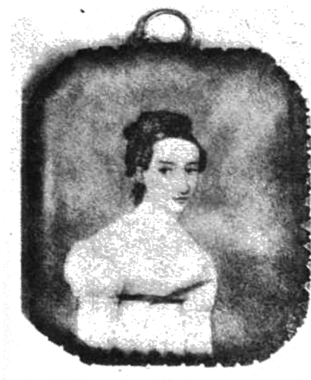
Марыля Верашчака. Мініяцюра належала Адаму Міцкевічу.

Пасля цяжкая хвароба прывяла яго ў Друскенікі, «на воды». Але, на жаль, лекаванне не дало чаканага выніку, і 23 жніўня 1847 г. Ян Чачот, пражыўшы крыху болей за 50 гадоў, памёр у суседняй з Друскенікамі вёсцы Ротніца, дзе і быў пахаваны паблізу касцёла. Адам Міцкевіч, са спазненнем даведаўшыся пра смерць дарагога сябра, з болем у сэрцы пісаў 26 чэрвеня 1853 г. Ігнату Дамейку з Парыжа ў Чылі: «Дарагі Ігнат, вось што-кольвек пра нашых былых сяброў і мінулыя часы. З двух канцоў зямлі, якія аддзялілі нас адзін ад аднаго, мы бачым па-рознаму цяперашнія часы, у мінулым жа мы сустракаемся па-ранейшаму. Не ведаю, ці вядома табе, што ад нас пайшоў твой ранейшы таварыш, а мой стары друг (ад першага класа) Ян Чачот. Дзень яго смерці нам невядомы. Мы даведаліся толькі, што ён памёр, мне ўсё снілася пра яго адно і тое ж: што ён прыехаў у Парыж, а я з-за нейкіх перашкод не магу з ім пабачыцца. Гэта мучыла мяне ў сне, і я прачнуўся журботны. Мне доўга не хацелася верыць звесткам пра яго смерць, якія ў нас так цяжка праверыць. Цяпер я ведаю пэўна, што ён памёр. Доўгія гады і многа ўспамінаў звязвалі мяне з ім. Перад смерцю ён выдаў беларускія песні, і яны там выклікалі вялікую прыхільнасць...» 3 .