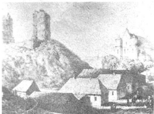
Наваградак. Руіны замка Міндоўга і фарны касцёл.

Толькі праз год пасля пераезду ў Вільню Ян Чачот змог ажыццявіць сваю мару стаць студэнтам «галоўнай школы Літвы» — Віленскага ўніверсітэта. Паступіў ён на факультэт маральных і палітычных навук з мэтай вывучыцца на адваката. Таму заўсёды хадзіў «пад руку» са «Статутам