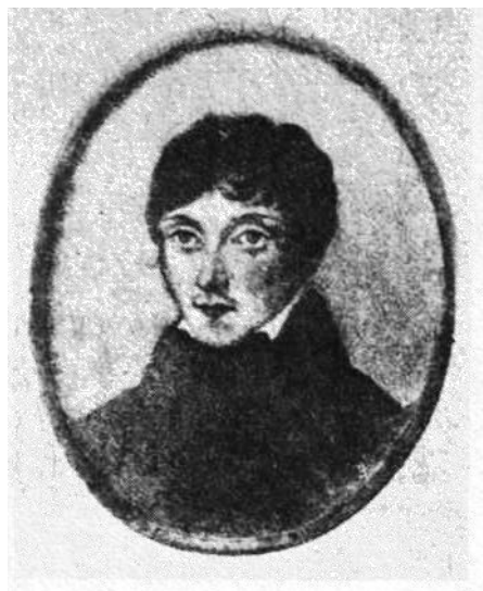
Адам Міцкевіч. Мініяцюра належала Марылі Верашчацы.