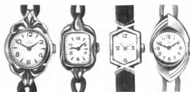
Часы наручные. Конец 1950-х гг.