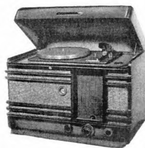
Радиола «Минск-Р-7». Конец 1950-х гг.