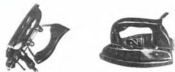
Утюги. Конец 1950-х гг.