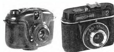
Фотоаппараты. Конец 1950-х гг.