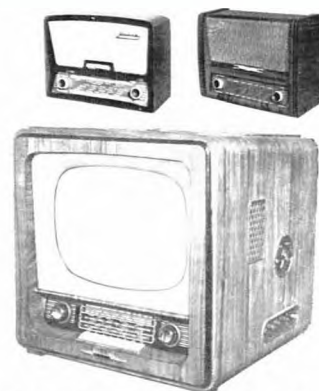
Радиоаппаратура. Конец 1950-х гг.