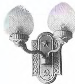
Бра для общественного интерьера. Конец 1950-х гг.