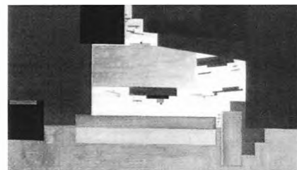
УНОВИС. К. Малевич. Эскиз праздничной трибуны.