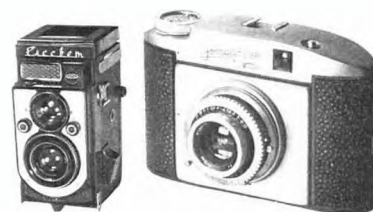
Фотоаппараты «Рассвет» и «Эстафета». Конец 1950-х гг.