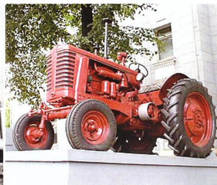
Автомашина «МАЗ» и трактор «Беларусь». 1950-е гг.