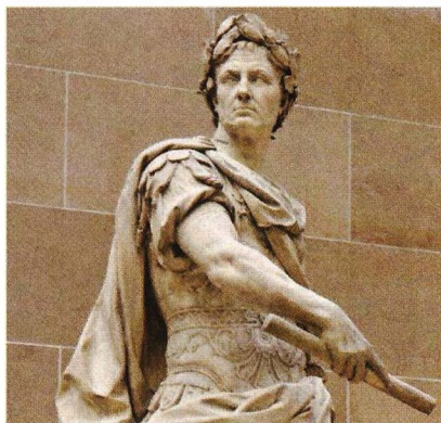
Юлий Цезарь. Мраморная статуя эпохи Людовика XIV. Скульптор Никола Кусту

С 45 года до н. э. Гай Юлий Цезарь установил календарь, в основе которого был солнечный год из 365 дней, начинавшийся с января – месяца, посвященного двуликому богу Янусу. До реформы римляне использовали календарь, основанный на лунном цикле; год в нем тоже состоял из 12 месяцев, но количество дней было иное: только 355. В каждом месяце выделялись особые дни: календы, которые первоначально были днем новолуния, ноны – днем первой четверти луны, иды – днем полнолуния. После реформы Цезаря эти особые дни сохранились, однако из-за разницы в продолжительности года утратили привязку к лунному циклу и были просто зафиксированы: календы как первый день месяца, ноны – пятый, иды – тринадцатый (в большинстве месяцев). В марте, мае, июле и октябре ноны приходились на седьмой, а иды на пятнадцатый день. Остальные дни считались как предшествующие одному из главных – в результате получилась сложная система, где, например, 31 января называлось «днем накануне февральских календ». Римская повседневность выстраивалась циклически вокруг отдельных дней месяца, имевших большее значение, чем остальные. Кроме того, жреческие коллегии на основании результатов специальных гаданий могли объявлять отдельные дни счастливыми или несчастливыми. Этим руководствовались политики и полководцы, выбирая, например, когда именно лучше выступить в поход. Летоисчисление было двойным: