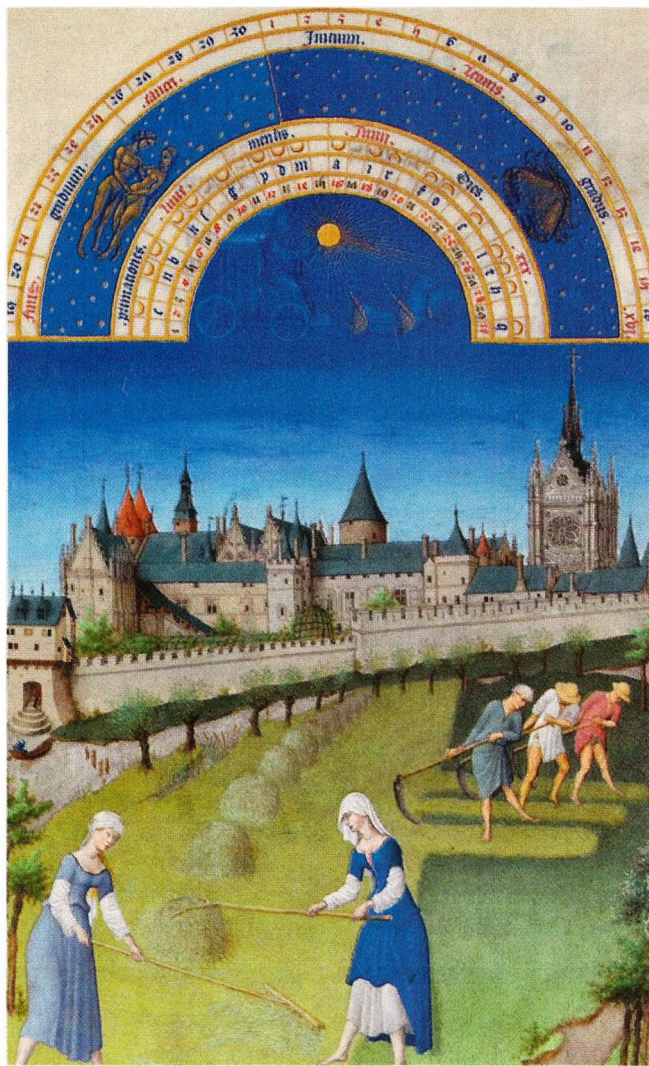
Июнь и соответствующий этому месяцу вид полевых работ, сенокос. Миниатюра братьев Лимбургов из «Великолепного часослова герцога Беррийского». XV век

К 1283 году относится самое раннее упоминание механических часов в Европе. То было устройство, установленное в монастыре Святого Петра в Данстемле. В XIV–XV столетиях такие часы стали появляться на башнях городских ратуш по всей Западной Европе. Первоначально они не имели минутной стрелки и были не особенно точны, но их распространение означало, что учет времени перешел из ведения церкви к городской коммуне. Или – к королю, как это случилось в Париже, где по распоряжению Карла V с 1370 года все колокола должны были звонить в соответствии с башенными часами коро-