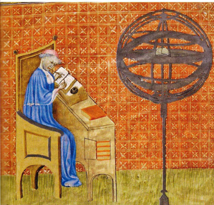
Портрет средневекового философа и математика Никола Орема с армиллярной сферой из его «Трактата о сфере»

рез лес или по равнинной местности, зимой или летом. В сознании древнего скандинава путь – всегда движение конкретных людей в данном конкретном пространстве.