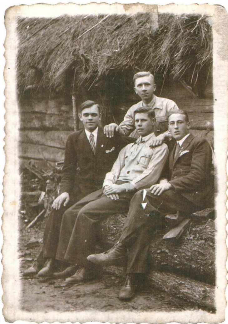
Жыхары Круговіцкай гміны. 1930-я гг.

Якая статыстыка па Круговіцкай гміне па веравызнанні? Насельніцтва ў асноўным складалася з праваслаўных: да іх належала 11 048 чалавек — 82,0%. Толькі 1827 жыхароў гміны былі католікамі — 13,6%. Іўдзеямі пазначаныя 592 чалавекі (485 з іх жылі ў мястэчку) — 4,4%