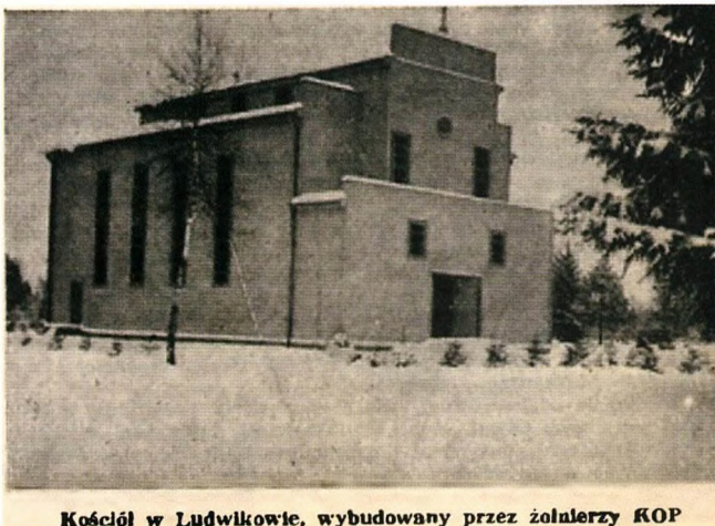
Kościół w Ludwikowie, wybudowany przez żołnierzy KOP

Адбітак фота ў газеце міжваеннага часу касцёла ў Людвікове. Крыніца: Kościół, zbudowany przez żołnierzy KOP w Ludwikowie // Wiarus. — 1939. — Nr. 8, 19 lut. — S. 268.