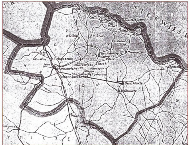
План Круговіцкай гміны міжваеннага перыяду.

Так, фактычна з'яўляючыся гарадскім паселішчам з насельніцтвам больш чым 1 тыс. чалавек, Ганцавічы ў азначаным плане асабліва паказальныя. Пры мінімуме прадстаўнікоў мясцовай нацыянальнасці (2,7%), які толькі мог быць у беларускім асяроддзі, праваслаўных было зарэгістравана ў 6,5 раза больш (17,5%). Нават з улікам пазначаных іншымі (але славянскімі) нацыянальнасцямі (такіх у Ганцавічах знайшлося няпоўныя