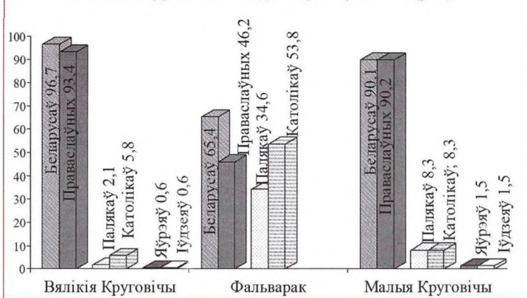
Дыяграма "Нацыянальны і канфесійны склад насельніцтва в. Вялікія Круговічы, аднайменнага фальварка і в. Малыя Круговічы паводле перапісу 1921 г. (у %)".

Што датычыцца цэнтра Круговіцкай гміны, дык у гэтай вёсцы беларусамі былі запісаныя 645 чалавек — 96,7%. Нязначная доля прыпадала на палякаў (14 чалавек — 2,1%) і яўрэяў (4 — 0,6%). Яшчэ столькі (4 чалавекі) былі аднесеныя да іншай, не ўказанай у крыніцы нацыянальнасці. Большасць кругаўцоў нале-