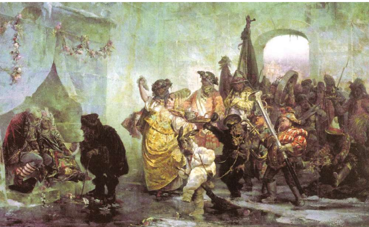
«Ледяной дом». Валерий Якоби. 1878 г.