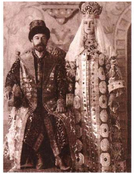
Николай II в образе царя Алексея Михайловича и Александра Федоровна в образе царицы Марии Милославской. Фото 1903 года

Бал состоялся 11 февраля (по старому стилю) 1903 года. Мероприятие произвело сильнейшее впечатление на иностранцев, приглашенных на повтор маскарада через два дня. В 1911 году выпустили колоду карт «Русский стиль», дам и королей которой срисо-