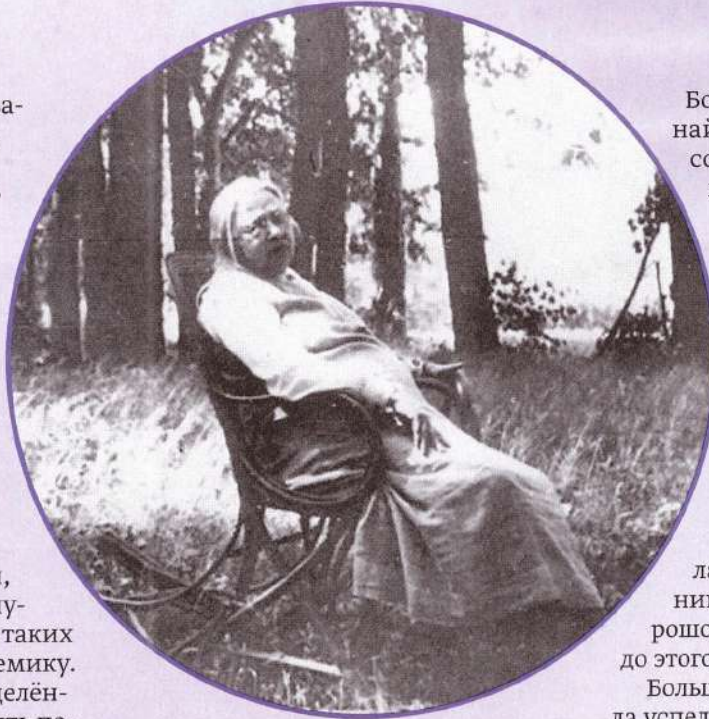
▲ Крупская в доме отдыха «Архангельское». Московская область, Красногорский район, 1936 год

«Конечно, в борьбе с меньшевиками и эсерами мы привыкли крыть наших противников, что называется, матом, и, конечно, нельзя допустить, чтобы члены партии в таких тонах вели между собою полемику. Необходимо поставить определённые рамки, научиться говорить товарищески. Но те сомнения, те взгляды, те особенности, которые вытекают из наблюдения отдельных