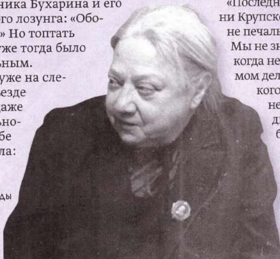
▶ Крупская. 1935–1938 годы

Однако уже на следующем съезде Крупская даже такого вольнодумства себе не позволяла: