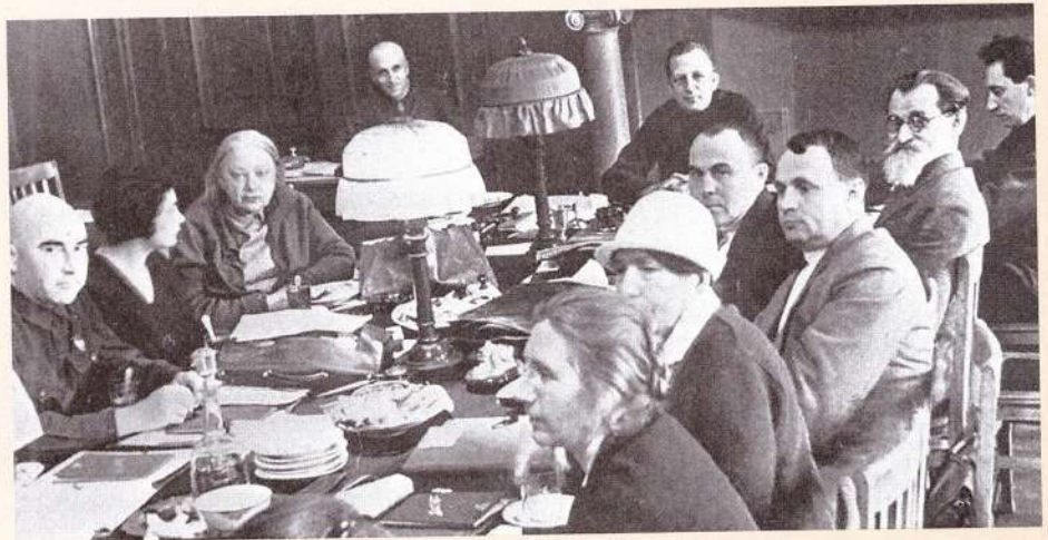
Крупская (третья слева) на заседании коллегии Наркомата народного просвещения. 1935 год

Единственным реальным делом Крупской осталась её работа в Наркомпросе. С момента создания Главполитпросвета (идеологического