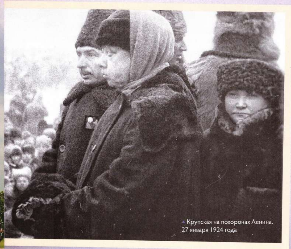
▲ Крупская на похоронах Ленина. 27 января 1924 года

Я пишу, чтобы рассказать вам, что приблизительно за месяц до смерти, просматривая вашу книжку, Владимир Ильич остановился на том месте, где вы даёте характеристику Маркса и Ленина, и просил меня перечитать это место, слушая внимательно, потом ещё раз просматривал сам.