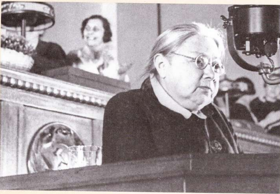
▲ Крупская на Втором съезде колхозников-ударников. 1935 год

«Надо ли давать эту книжку маленьким ребятам? Крокодил... Вместе с забавой здесь даётся и другое. Изображается народ: народ орёт, злится, тащит в полицию, народ — трус, дрожит, визжит от страха ("А за ним-то народ и поёт и орёт...", "Рассердился народ и зовёт и орёт, эй, держите его да вяжите его. Да ведите скорее в полицию", "Все дрожат, все от страха визжат..."). К этой картинке присоединяются ещё обстриженные под скобку мужички, "благодарящие" шоколадом Ваню за его подвиг. Это уже совсем не невинное, а крайне злобное изображение, которое, может, недостаточно осознаётся ребёнком, но залегает в его сознании...»