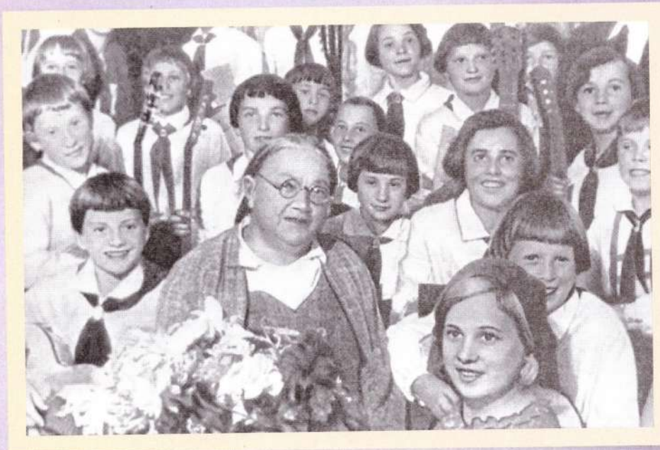
▼ Крупская с пионерами. 1936 год

сталинских поручений разного рода моральной допустимости) пропагандист Емельян Ярославский неожиданно обнаружил, что в ходе усердной чистки библиотек от идеологически вредной литературы с полок были изъяты не только некоторые его произведения. Мало того, под запретом оказались отдельные книги Маркса, Ленина и (о ужас!) Сталина!