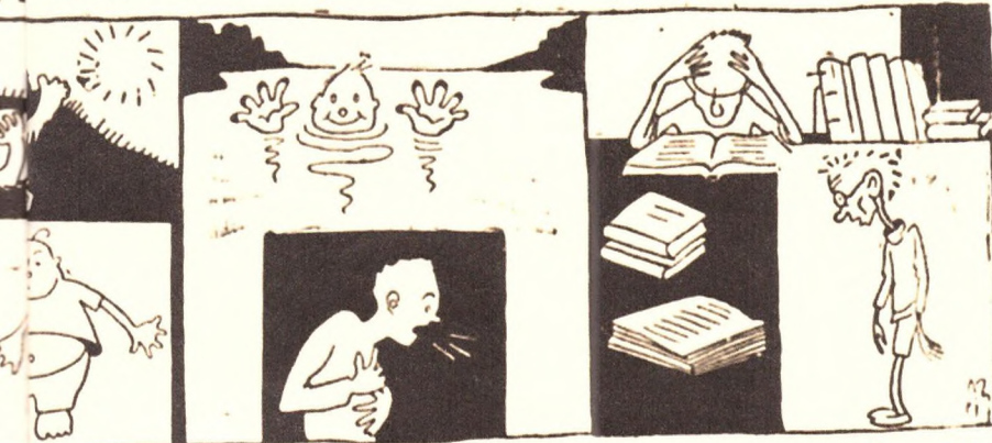
1) не купаться до простуды; 2) не сидеть за книгами до потери здоровья.