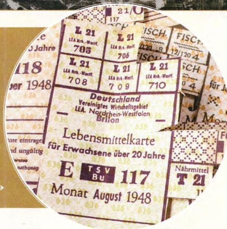
▲ Немецкие продовольственные карточки. 1948 год

союзников. Затем запрет начинает постепенно ослабевать, становится возможно возобновить деятельность, правда, для этого нужны всевозможные лицензии. Зимой 1945-1946 годов бизнес кое-как заработал, но сохраняются серьёзные ограничения для «чувствительных»