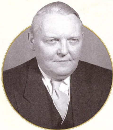
▼ Людвиг Эрхард. 1950 год

восстановить стимулы к труду, созданию сбережений и инвестированию, восстановить честность в уплате налогов и расширить налоговую базу за счёт сокращения уклонений от их уплаты. Радикально были сокращены налоги на недвижимость (с 2,5 до 0,75 %) и на наследство.