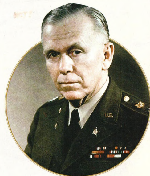
▼ Генерал армии Джордж Маршалл. 1946 год

В совокупности Западной Европе было предоставлено 13,2 миллиарда долларов, что составляет около 180 миллиардов долларов в современных ценах (Восточная Европа в плане