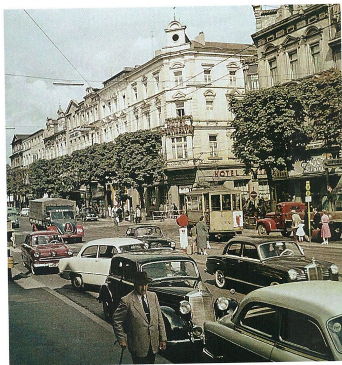
▼ Привокзальная площадь города Бонна, Германия. 1955 год

Автор — кандидат экономических наук, старший партнёр группы компаний по управлению частным капиталом Movchan's Group