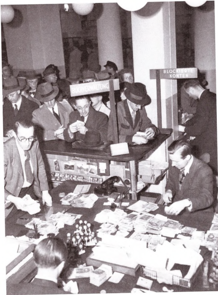
▲ Обмен старых денег на новые в Гамбурге. Июнь 1948 года