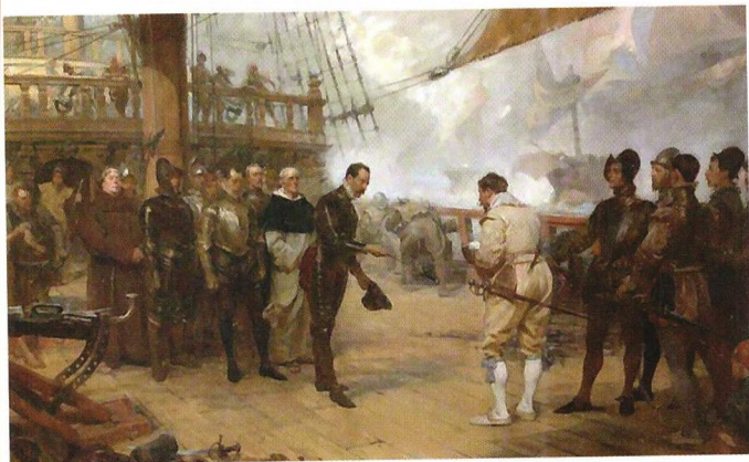
▲ Сдача в плен Педро де Вальдеса (адмирала эскадры «Андалусия» Непобедимой армады) Фрэнсису Дрейку. Джон Сеймур Лукас, 1889 год