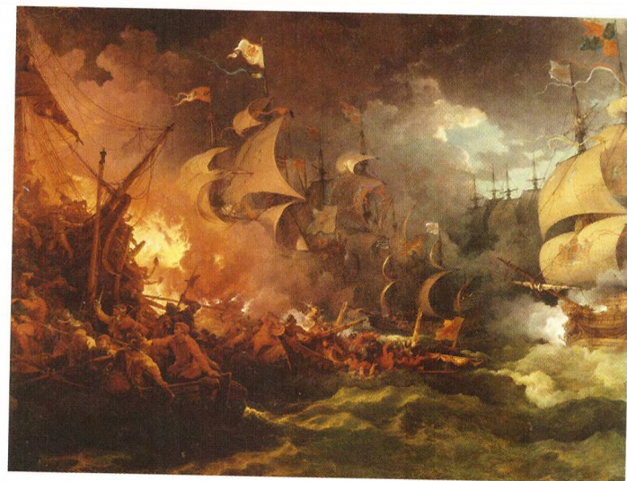
▲ Разгром испанской армады 8 августа 1588 года. Филипп Якоб де Лютербург, 1796 год

В XVI веке главным объектом каперства становятся испанские галеоны, везущие золото и серебро из Нового Света (португальцы открыли золотые месторождения в Бразилии позднее, на рубеже XVII и XVIII столетий). Впрочем, такими призами, как табак, какао, сахар и красители (индиго и кошениль) «лицензированные пираты» тоже не брезговали. Первый запоминающийся удар нанёс в 1522 году француз Жан Флери. Неподалёку от Азорских островов он силами небольшой эскадры напал на караван из трёх судов, нагруженных сокровищами короля ацтеков Монтесумы, — дар Кортеса испанскому королю — и захватил два из них. Добычей везучего капера стали 300 килограммов жемчуга, 230 килограммов золота, сундуки с драгоценными камнями и слитки серебра. К богатствам материальным прилагались сокровища духовные: в руки Флери попал отчёт Кортеса о покорении Мексики. У француза немедленно нашлись подражатели, и вскоре испанцы вынуждены были