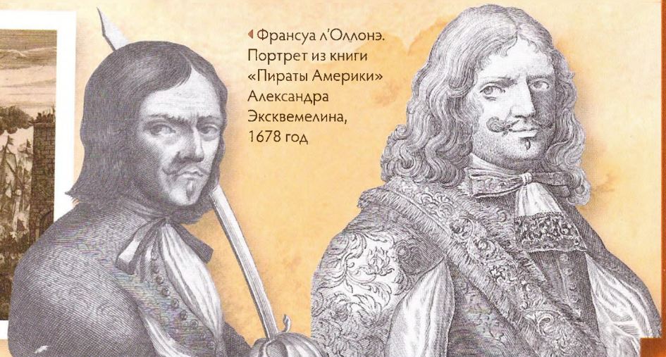
◀ Франсуа л'Оллонэ. Портрет из книги «Пираты Америки» Александра Эксквемелина, 1678 год