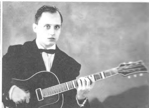
Мулявин-гитарист. Конец 1950-х годов

грацией двигалась и на сцене, и в жизни. Их встреча произошла в Калининграде в 1959 году. Она уже была звездой филармонии, а он – молодым артистом ансамбля Краснознаменного Балтийского флота.