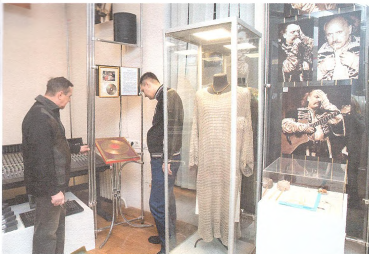
В музее Владимира Мулявина в Минске

Можно часами рассказывать о том, как Мулявин создавал программы для «Песняров». Как он смело говорил о трагической правде войны и геноцида, когда об этом предпочитали молчать. Как поразил своих завистников, создав потрясающую концертную программу на стихи Маяковского