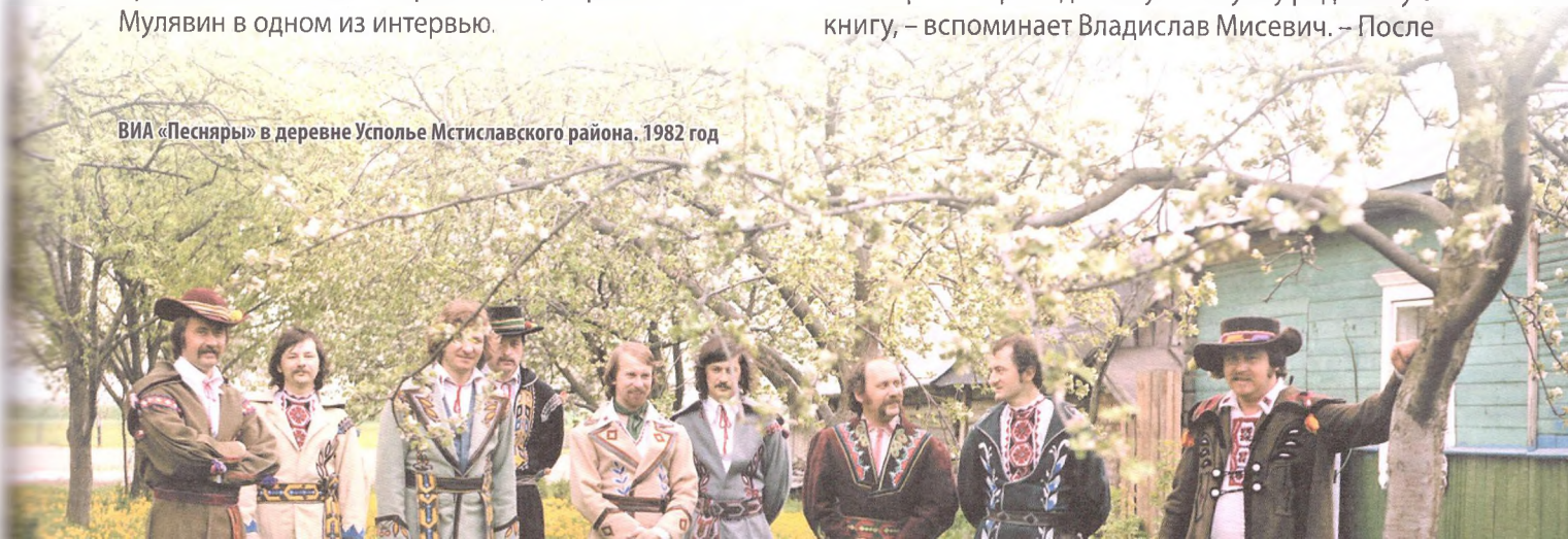
ВИА «Песняры» в деревне Усполье Мстиславского района. 1982 год