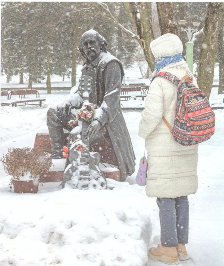
У памятника на бульваре Владимира Мулявина в столице

Можно часами рассказывать о том, как Мулявин создавал программы для «Песняров». Как он смело говорил о трагической правде войны и геноцида, когда об этом предпочитали молчать. Как поразил своих завистников, создав потрясающую концертную программу на стихи Маяковского