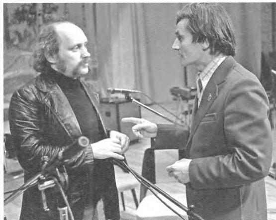
Владимир Мулявин и Игорь Лученок. 1977 год

впечатление, что он видел в них не просто людей, а части единого, искусно настроенного музыкального механизма. Леонид Тышко вспоминал с долей самоиронии, что они тогда еще не были профессионалами. Он играл на домре, Мулявин – на балалайке. А солисты, по его словам, были наполовину певцами, наполовину просто хорошими парнями. Кашепаров и Борткевич пришли уже в сложившийся коллектив.