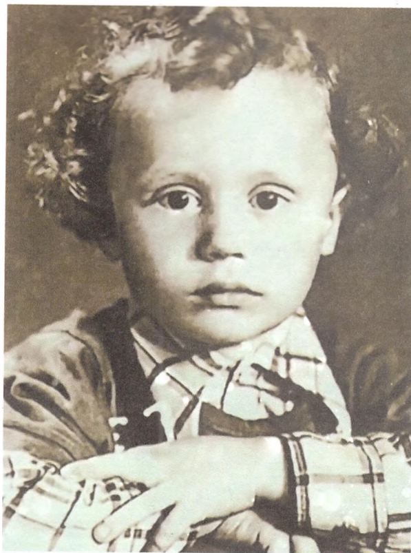
Володя Мулявин. Свердловск, середина 1940-х годов

На другом, не менее примечательном снимке видим юного Мулявина с... трубой. Это полностью разрушает легенду о том, что он умел играть только на струнных. И таких загадок и странностей – море,