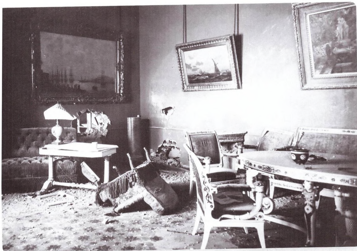
◀ Гостиная императрицы Марии Фёдоровны с пробитой артиллерийским снарядом стеной. Петроград, ноябрь 1917 года

Военно-революционного комитета, что по данным караула Красной гвардии, стоящего у штаба округа, происходит систематическое расхищение вещей из Зимнего дворца. Караул преображенцев, несущий охрану Зимнего дворца, фактически не только не охраняет, но по сведениям нашего караула, даже содействует разгрому дворца. Бюро Центральной комендатуры просит Военно-революционный комитет принять самые решительные меры для действительной охраны Зимнего дворца.