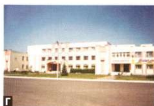
Рис. 6. Здания, доминирующие в композиции центра села: А – Дворец культуры в аг. Юровичи Калинковичского р-на; Б – торговый центр в аг. Глушковичи Лельчицкого р-на; В – Дворец культуры в аг. Судково Хойникского р-на; Г – объект комплексного назначения в аг. Холмеч Речицкого р-на

Акцент планировки любого агрогородка – центральная площадь, где обычно размещаются административное здание, школа, магазин или торговый комплекс, клуб, культовые постройки (в Гомельском районе – Храм Успения Пресвятой Богородицы в аг. Красное, Храм в честь Покрова Пресвятой Богородицы – в аг. Еремино, Храм Святителя Николая Чудотворца – в аг. Бобовичи и др.).