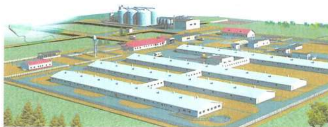
Рис. 7. Общий вид свиноводческой фермы в КСУП «Новая Нива» Лельчицкого р-на

Среда во многом определяется ландшафтно-архитектурными формами, к которым относятся: художественно обработанный рельеф (геопластика), мощения, водные объекты, древесно-кустарниковые и цветочные композиции, оборудование мест