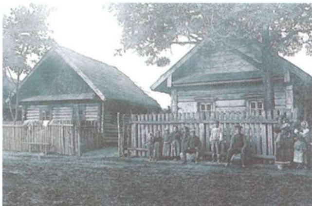
Рис. 1. Дома крестьян в д. Брановичи Слуцкого р-на. Фото 1912 г.

В 1950-е гг. были разработаны проекты планировки и застройки центральных деревень, предусматривалось их развитие за счет свободных прилегающих территорий. Жилая зона решалась по квартальной схеме с усадебными домами и участками на одну семью не более 0,20 га.