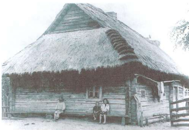
Рис. 2. Общий вид дома крестьянина с кровлей из соломы в местечке Любяшов Пинского р-на. Фото 1912 г.