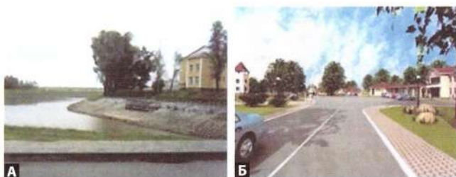
Рис. 8. Агрогородок Лясковичи Петриковского р-на: А – обустройство водоемов в рекреационной зоне; Б – ландшафтная организация центральной улицы