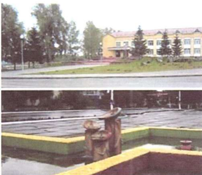
Рис. 9. Примеры архитектурно-ландшафтного благоустройства

отдыха, детских игровых и спортивных площадок, информационные конструкции, пленэрная скульптура, элементы праздничного оформления и др. Формируются они с использованием как природных, так и искусственно преобразованных человеком (антропогенных) элементов предметно-пространственной среды. По их соотношению выделяют следующие типы: