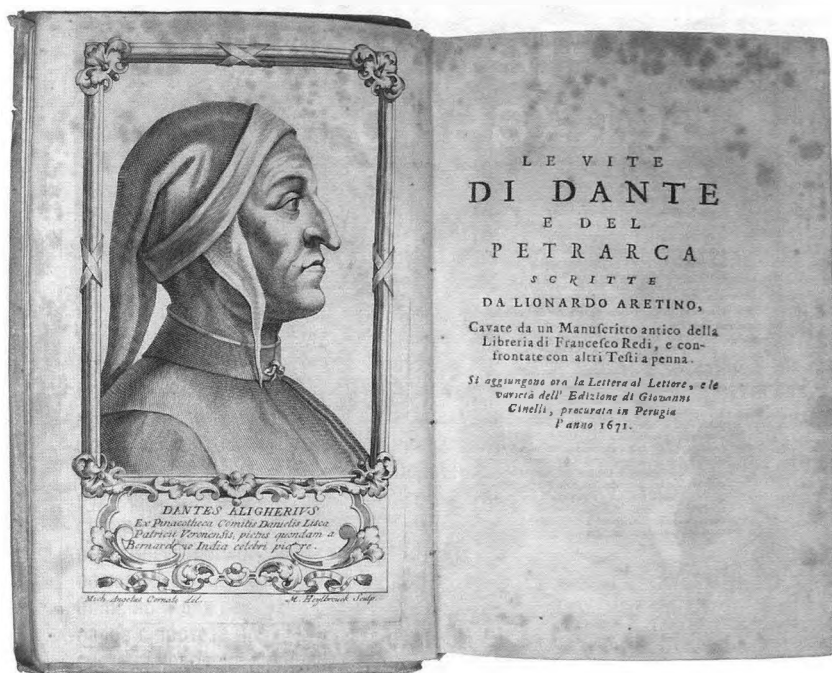
Портрет Данте в издании «Жизнеописание Данте и Петрарки». Леонардо Бруни (Аретино). 1671 год. Впервые эта книга была издана в 1436 году

Исторически все три гения принадлежали одной эпохе, хотя и не одному поколению. Когда угас Данте, Петрарка