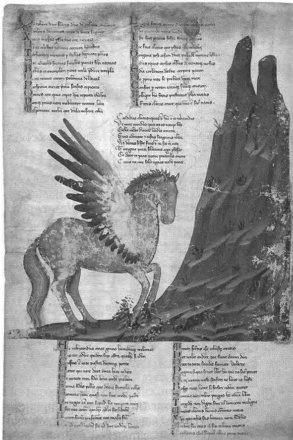
Пегас. Страница иллюстрированного манускрипта «Cantina regia» Конвентеволе да Прато. Художник Пачино ди Бонагуида (1280—1340)

Италия Данте не только была раздроблена, но и находилась в постоянной войне, две силы — империя и папство — веками боролись за верховенство, города Италии боролись друг с другом, внутри города тоже шло противоборство. Сама комму-