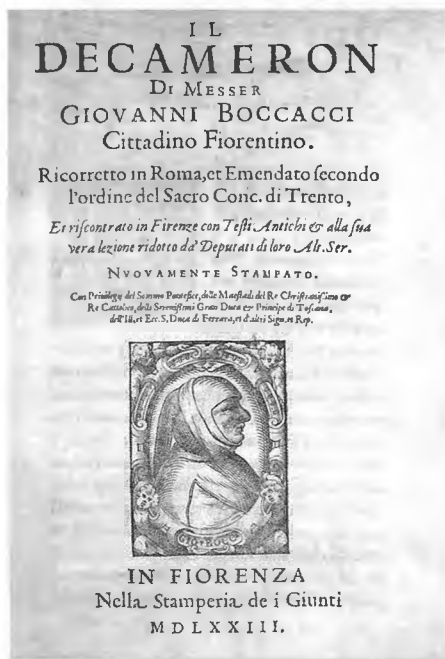
Титульный лист издания «Декамерона» Боккаччо. Флоренция. 1573 год.

ной власти. Внутри города происходило столкновение сторонников папской и императорской партии.