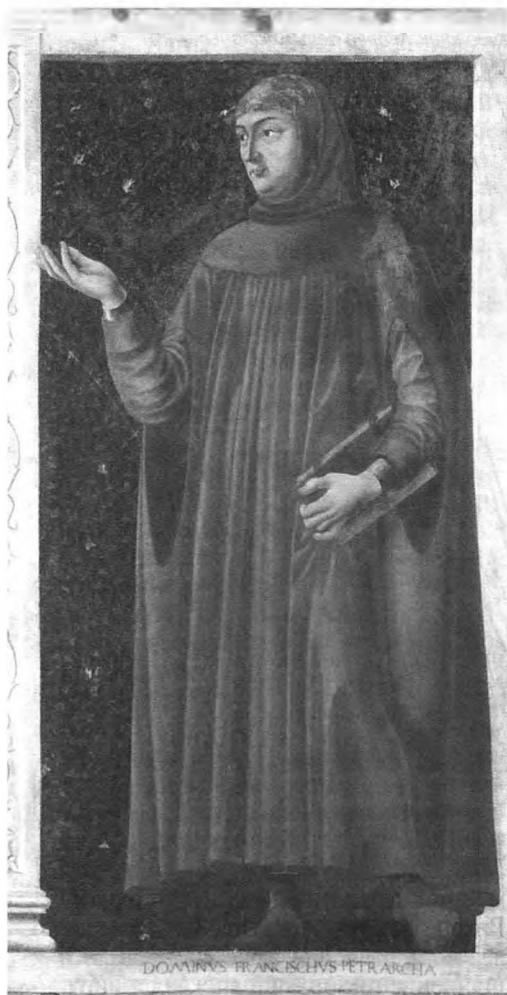
Петрарка. Художник Андреа дель Кастаньо (1420—1457)

возвышающей любви и сжигающей его ненависти, о моментах духовной биографии Данте, о мысленной встрече Данте с Вергилием, блистательным стихотворцем Древнего Рима, который в Комедии становится проводником и наставником первого поэта зари Возрождения. Комедия была создана на вольгаре, с использованием неологизмов, строки и образы Комедии навсегда вошли в итальянский язык, создали его основу. В гениальном сочинении Данте отразились и бессмертные идеи, и ценные приметы времени, которому это сочинение принадлежит.