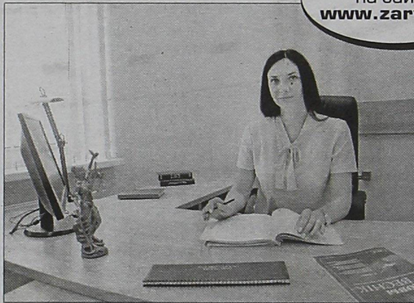
В кабинетах судей созданы все необходимые условия для работы

В объект было вложено 27,7 миллиона рублей, из которых 18,3 миллиона выделил республиканский бюджет. Подрядчиком выступил филиал СУ-98 ОАО «Строительный трест №8».