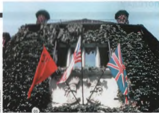
*5 Флаги союзников над дворцом в Цецилиенхофе.

Столь впечатляющая дипломатическая победа была достигнута на фоне безукоризненной