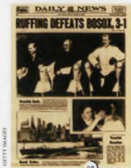
°8 «Дейли ньюс» от 3 августа 1945 года. Фото на память.

Поездка прошла без происшествий благодаря зачистке от «враждебного элемента» 40-километровой зоны по ходу движения поезда. В современных сериалах очень любят показывать коварство этого элемента, но о прохождении сталинского поезда никто из бандитов и дивер-