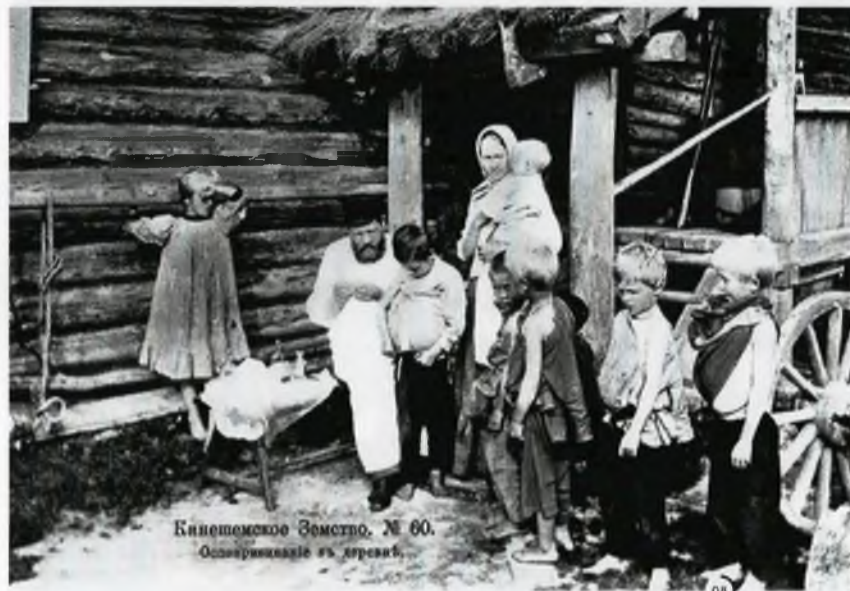
Киевское Земство. № 60. Освоившиеся в деревне.

Портрет Томаса Димсдейла и его труд «Нынешний способ прививания оспы...». 1770 год.