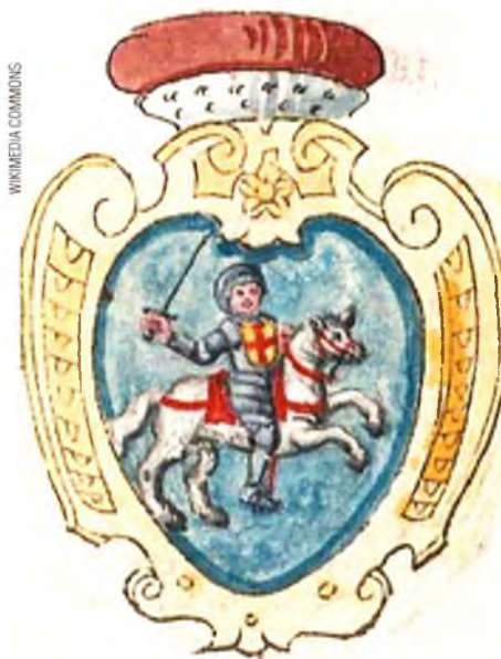
Герб Полацкага княства з гербоўніка 1586 года. Як вам такі варыянт «Пагоні»?

Аднак у XI стагоддзі прыток скандынаўскіх ваяроў паступова