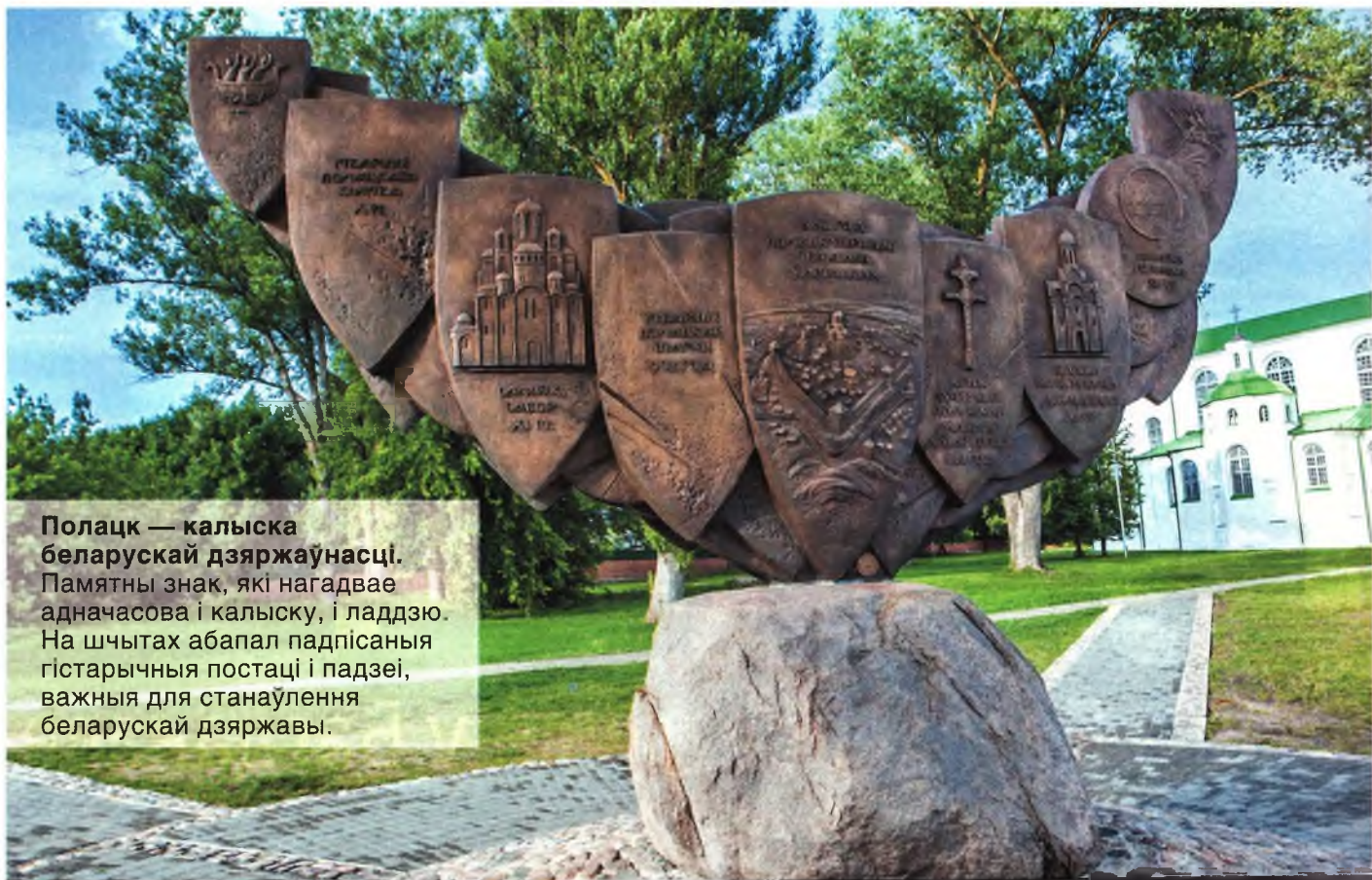
Полацк — калыска беларускай дзяржаўнасці. Памятны знак, які нагадвае адначасова і калыску, і ладдзю. На шчытах абাপал падпісаныя гістарычныя постаці і падзеі, важныя для станаўлення беларускай дзяржавы.

Яны мелі досвед хуткай арганізацыі, маглі калектыўна прымаць рашэнні, таксама калектыўна іх рэалізоўваць. У выпадку патрэбы яны маглі аказаць ціск на князя, нават знявольць яго, збройна выступіць супраць княскай дружыны. Гэта былі людзі, што прывыклі рэалізоўваць свае калектыўныя мэты, не падмяняючы інтарэсамі князёў інтарэсы сваёй супольнасці і сваёй краіны – Полацкай зямлі. ♦