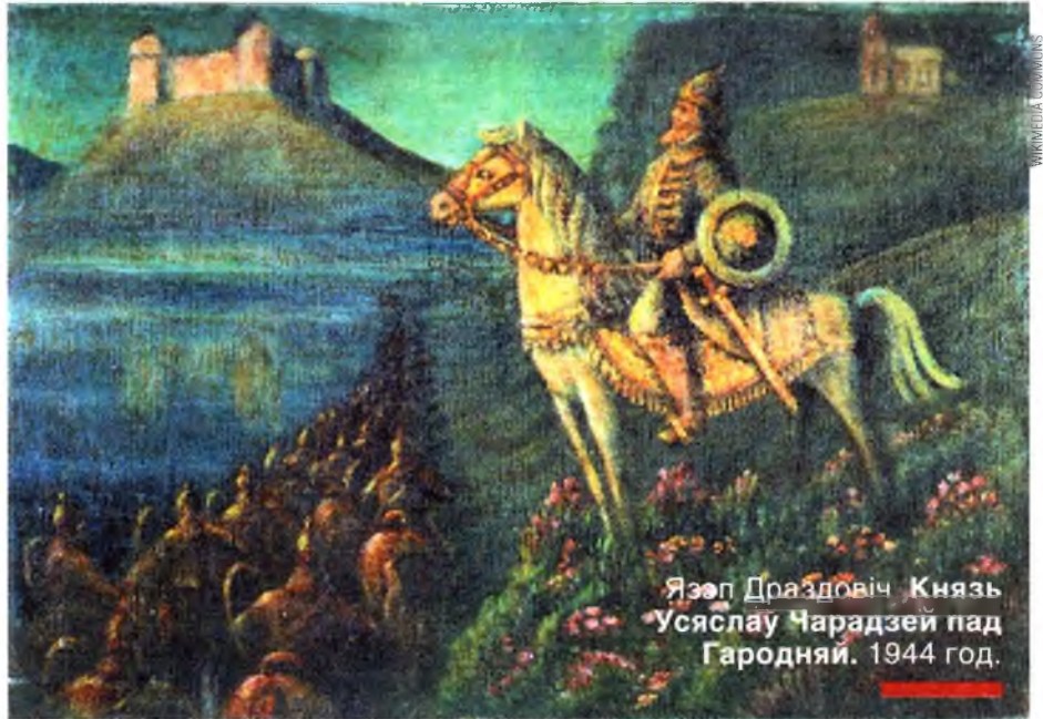
Язэп Драздовіч. Князь Усяслаў Чарадзей пад Гародняй. 1944 год.

Крыніцы пайменна прыгадваюць шасцярых сыноў Усяслава. Адзін з іх, Давыд, быў па нейкіх прычынах пазбаўлены ўдзела