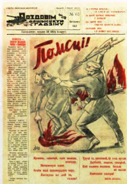
Газета-плакат «Раздавим фашыстскую гадзіну». Кастрычнік 1942 год. У такім жа духу мелася выходзіць і прапанаваная Панамарэнкам газета для беларускіх армій.

У канцы 1980-х гадоў у сховішчах тагачаснага партыйнага архіва (цяпер у складзе Нацыянальнага архіва Рэспублікі Беларусь) навукоўцы адшукалі чарнавікі «жнівёнскай» і «кастрычніцкай» дакладных для Сталіна.