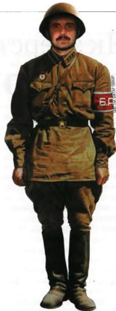
Палявая форма адзення байцоў Беларускай асобай арміі. Гістарычная рэканструкцыя.

Некаторы час у будынку, дзе праходзіла гэтая сесія, засядаў наваствораны Наркамат замежных спраў БССР. Якое памяшканне выдзелілі для Наркамата абароны (сучаснай