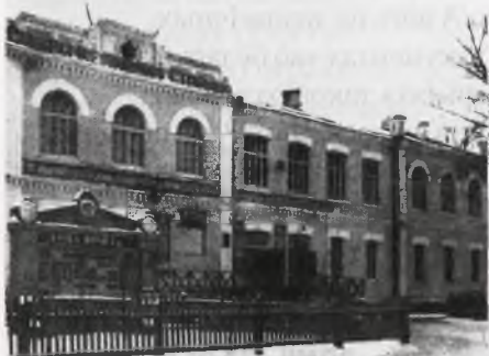
Клуб запалкавай фабрыкі «Везувій» у Гомелі, дзе нарадзіўся фіктыўны Наркамат абароны БССР. 1940-я.

У пачатку 1944 года гісторыя з нацыянальнымі беларускімі