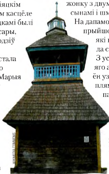
Званіца ўніяцкай царквы ў Шарашове на Пружаншчыне, паблізу якога рос Баброўскі.

Кожнага з нас ён вывучыў і кожнага намагаўся накіраваць згодна са здольнасцямі і схільнасцямі», — прызнаецца пазней Павел. ►