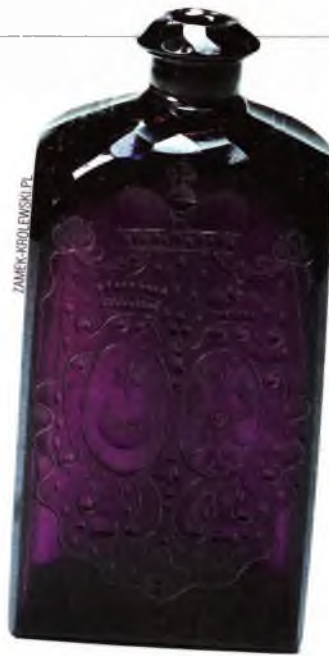
Пляшка з налібоцкай гуты. З фондаў Каралеўскага замка на Вавелі ў Кракаве.

Справы на Налібоцкай шкляннай мануфактуры ішлі добра, і хутка Ганна Радзівіл заклала яшчэ адну такую вытворчасць у мястэчку Урэчча (сучасны Любанскі раён). Тут ужо ўзорам для пераймання была Саксонская каралеўская мануфактура. Рабілі тут не толькі шклянны посуд, але і любыя прадметы інтэр'еру, якія ўтрымліваюць