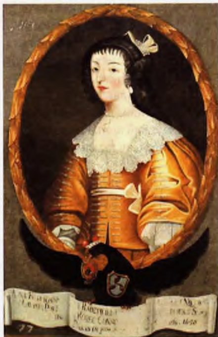
Партрэт Ганны з Нацыянальнага музея ў Варшаве. 1730-я.

Мястэчка Ракаў у другой палове XVII стагоддзя пачувалася някеспка. Ужо