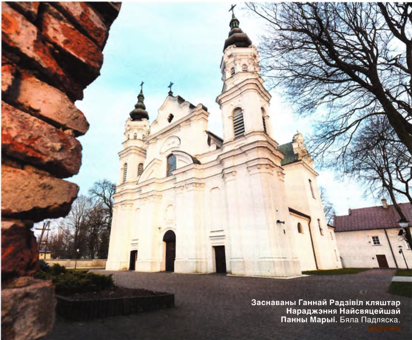
Заснаваны Ганнай Радзівіл кляштар Нараджэння Найсвяцейшай Панны Марыі. Бяла Падляска.

Усе гэтыя пахавальныя ўрачыстасці каштавалі Радзівілам касмічных грошай. Зрэшты, пры жыцці іх Ганна Сангушка Радзівіл дакладна сваёй дзейнасцю зарабіла. ♦