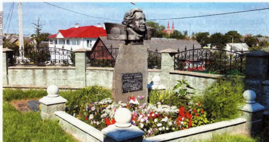
За заслугі Геніюш перад Праваслаўнай царквой (у зэльвенскі перыяд сваёй біяграфіі яна была адной з актыўных прыхаджанак мясцовага храма) ёй паставілі помнік на цвітары каля зэльвенскай Траецкай царквы. Адзіны такі выпадак на ўсю Беларусь.