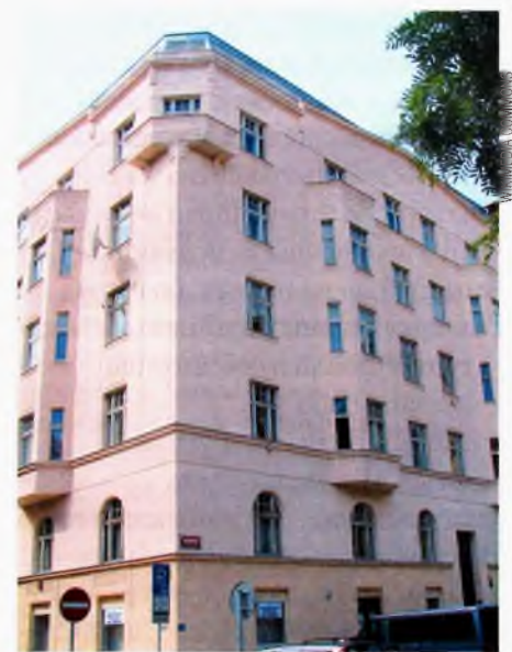
Дом 7 па вуліцы Германавай, у якім Геніюшы жылі ў Празе.