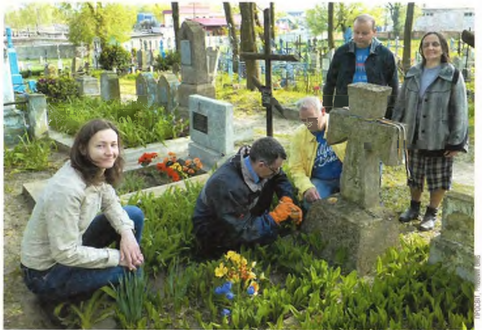
Жыхары Берасця прыбіраюць магілы вайскоўцаў Украінскай Народнай Рэспублікі на Трышынскіх могілках.

Відавочцы ўспаміналі, што з чыноўнікамі і дваранамі ён размаўляў па-расійску, а да сялян звяртаўся па-ўкраінску.