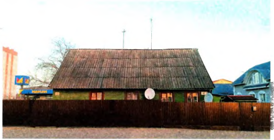
ФОТА 3. СЕМЬОНА АХУБА АЛЕКСАНДРЕНА ГАРБАЧОВА

Цяпер у доме на Пушкінскай, 102 жывуць людзі, а 90 гадоў таму была школа. Украінцы Львоўшчыны прывозілі настаўнікам і вучням літаратуру па Бугу, чаўнамі, каб не мець спраў з паліцыяй. Старыя здымкі школы зберагла ўнучка апошняй дырэктаркі.