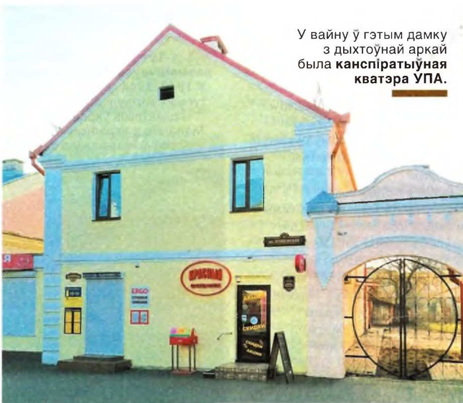
У вайну ў гэтым дамку з дыхтоўнай аркай была канспіратыўная кватэра УПА.

Фішка Берасця — яшчэ і дыхтоўныя міжваенныя сядзібы ў стылі канструктывізму.