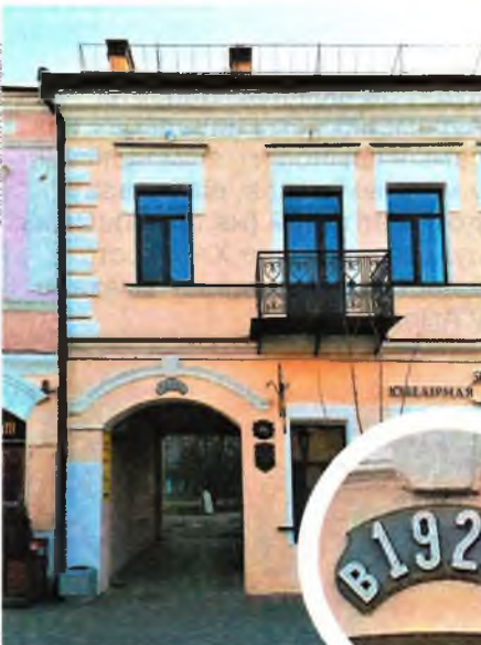
Вуліца Савецкая, 104 у Берасці. Звярніце увагу на надпіс над аркай. «в 1929 р», дзе «р» значыць «року» — «годзе» па-беларуску.

У міжваенны час украінцы і яўрэі Берасця не раз выступалі адзіным фронтам у апазіцыі да польскіх уладаў. Так, Абрам і Майсей Сарверы, уладальнікі Тэатра Сарвера (Свярдлова, 4),