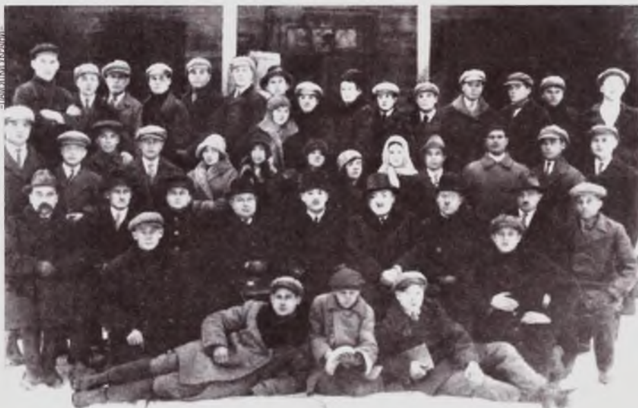
Сяляне з-пад Берасця — слухачы курсаў кааперацыі. Курсы праходзілі на месцы сучаснага ЦУМа.

Пасля кааператыўных курсаў селянін становіўся іншым чалавекам: ён не проста багацеў, а пачынаў па-новаму мысліць, успрымаў сябе гаспадаром і часткай сеткі.