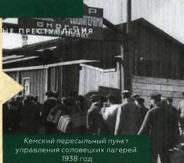
Кемский пересыльный пункт управления соловецких лагерей. 1938 год

гражданские лица призывного возраста, находившиеся на территории, занятой противником