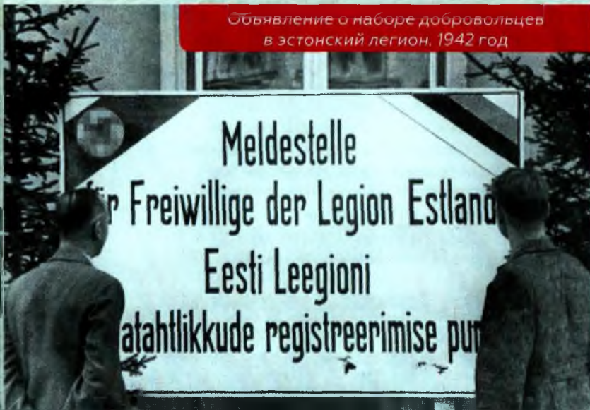
Объявление о наборе добровольцев в эстонский легион, 1942 год