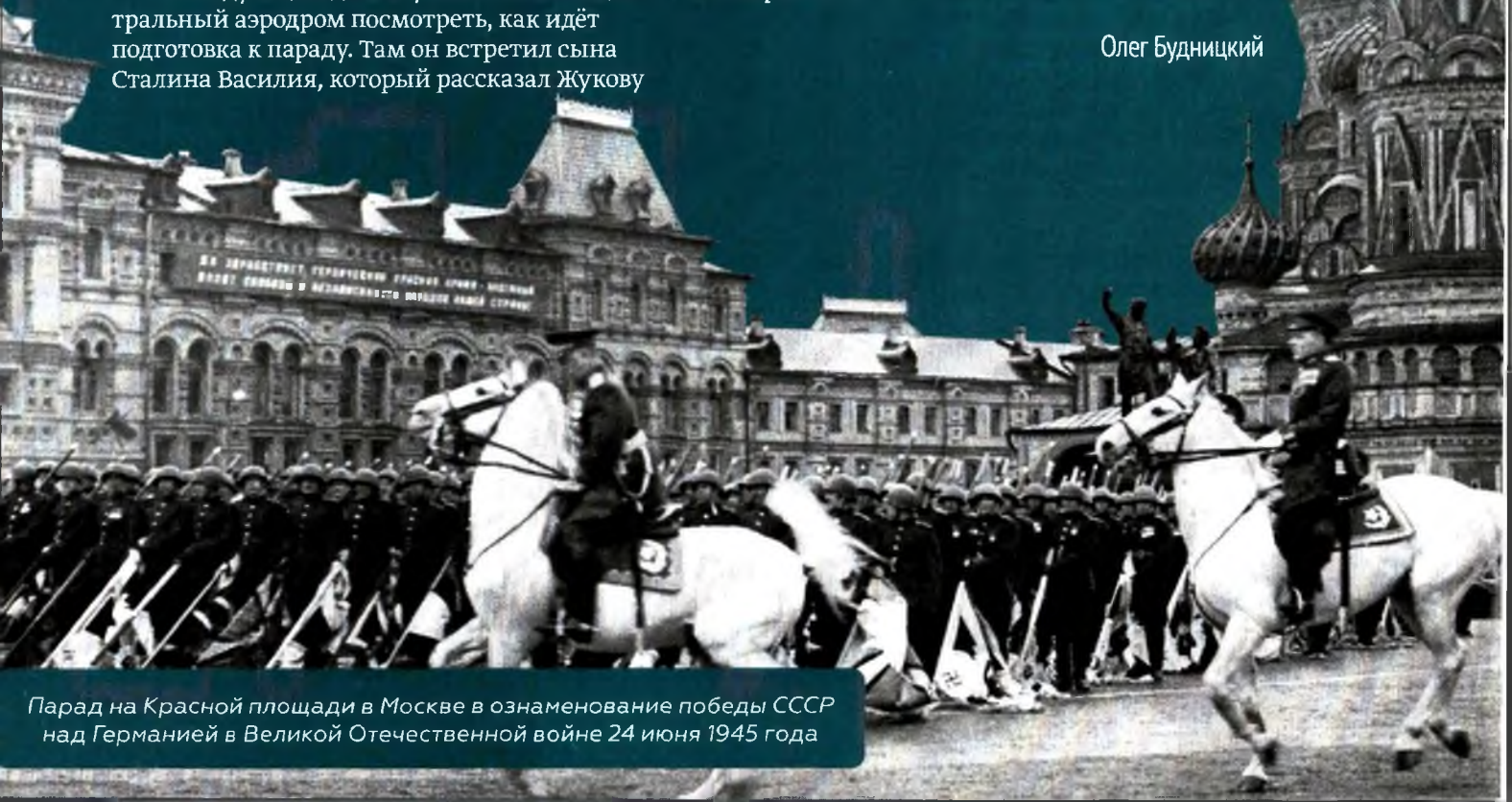
Парад на Красной площади в Москве в ознаменование победы СССР над Германией в Великой Отечественной войне 24 июня 1945 года