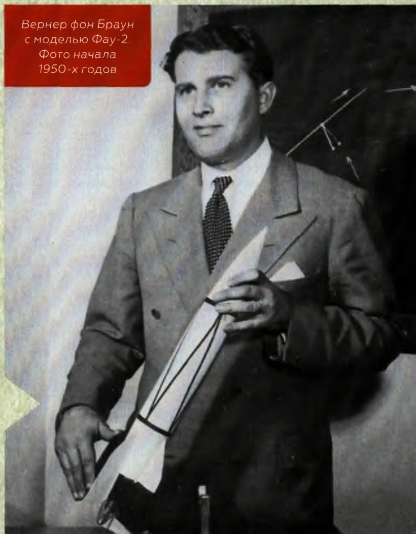
Вернер фон Браун с моделью Фау-2. Фото начала 1950-х годов