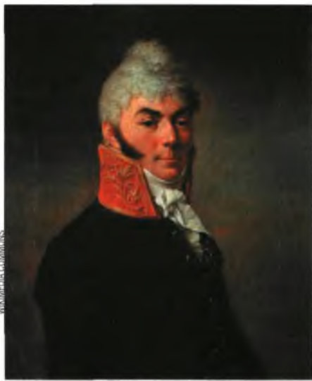
Мікалай Навасільцаў (1761–1838), знакаміты ў Беларусі рэпрэсіямі ў адрас студэнцкага таварыства філаматаў і філарэтаў, паспрыяў кар’еры Тэафіла Святаполк-Мірскага.

ад сената Царства Польскага пацвярджэння княжацкага тытула, прычым на падставе выключна сваіх слоў — ніякіх дакументаў прадстаўлена не было. Для такой авантуры трэба было мець сапраўды моцных апекуноў. Такім чынам малады шляхціч змог рэалізаваць старую мару сваёй сям’і.