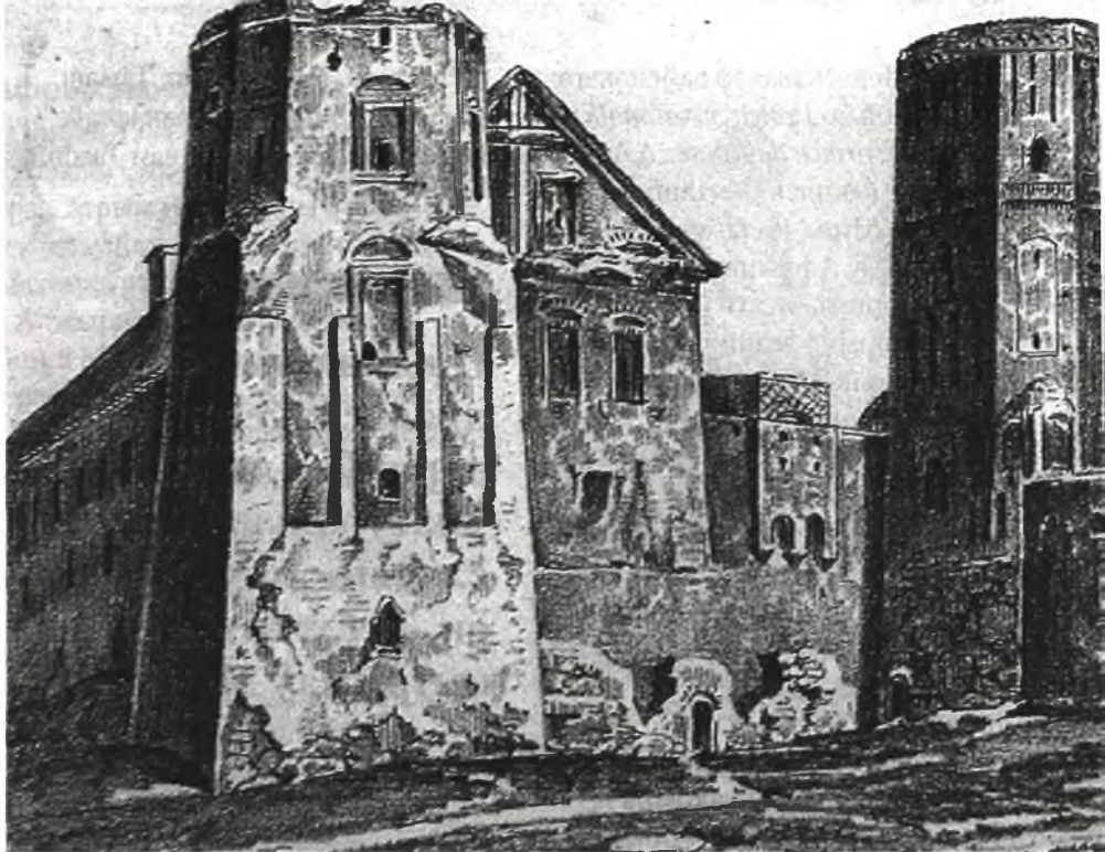
Замак Ілынічаў-Радзівілаў, які мы ведаем пад назвай Мірскі. Літаграфія з малюнка Францішка Максімільяна Сабяшчанскага, 1849 год.

медалёў і шчасліва скончыў сваё жыццё ў 1899 годзе ў французскай Ніцы. А сын Дзмітрыя і ўнук Івана Пётр Дзмітрыевіч Святаполк-Мірскі быў з 1895 года па чарзе губернатарам у некалькіх губернях, у тым ліку ў 1902–1904 гадах у Вільні, а ў 1904–1905 займаў пасаду міністра ўнутраных спраў Расіі.