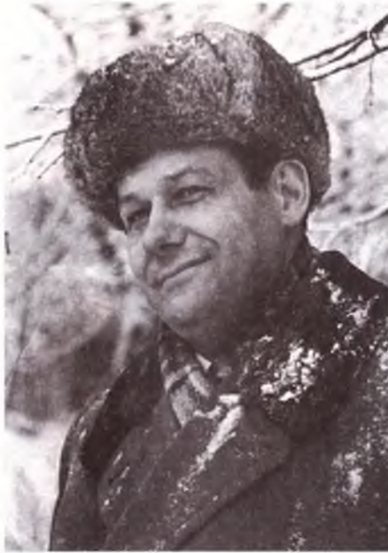
З АРХІВА СОНТ МІЛЕКОВ

Новым для беларускай літаратуры было і выкарыстанне ў «Палескай хроніцы» элементаў мясцовых гаворак. Якуб Колас, які пісаў «На ростанях» у часы, калі літаратурная мова яшчэ кадыфікавалася, не наважыўся на гэта. «Яны — частка агульнага каларыту беларускага нашага краю... наш брат-празаік не можа быць зусім абыякавым да таго, як гаварылі вякамі і гавораць людзі вялікай часткі нашай зямлі», — бараніў свае рашэнне Мележ. Ён спачатку пісаў дыялогі герояў літаратурнай мовай — без «ето» і «нібыто» — але яны зайгралі толькі тады, калі загучалі на роднай гаворцы.