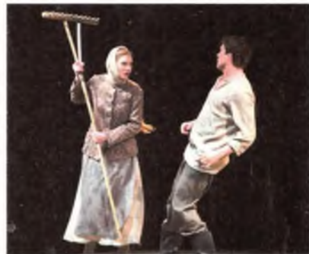
Сцэна з «Людзей на балоце» ў пастаноўцы Тэатра імя Янкі Купалы.

Цяжка было б чакаць іншага ад цыкла раманаў пра пакуты сялянства. Але як Мележ надрукаваў бы гэта ў сярэдзіне 1970-х? Ці пайшоў бы ▶