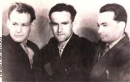
Іван Мележ, Янка Брыль і Усевалад Краўчанка — тры пісьменнікі, якіх першым заўважыў Кузьма Чорны.

Пісьменнік працаваў пяць гадоў, перагартваў архівы, сустракаўся са сведкамі падзей. Але ўсё ж