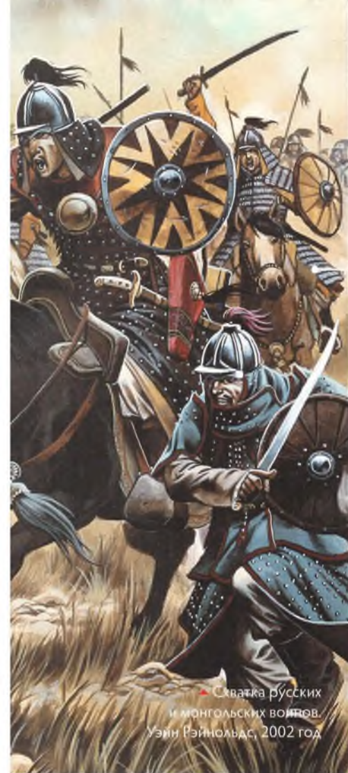
▲ Схватка русских и монгольских воинов. Уэйн Райнгольдс, 2002 год

Тяжёлым последствием монгольского вторжения стала почти исчезнувшая на Руси к XII веку работорговля. Монголы (а позднее их преемники из Золотой Орды) уводили десятки тысяч русских людей для продажи в рабство.