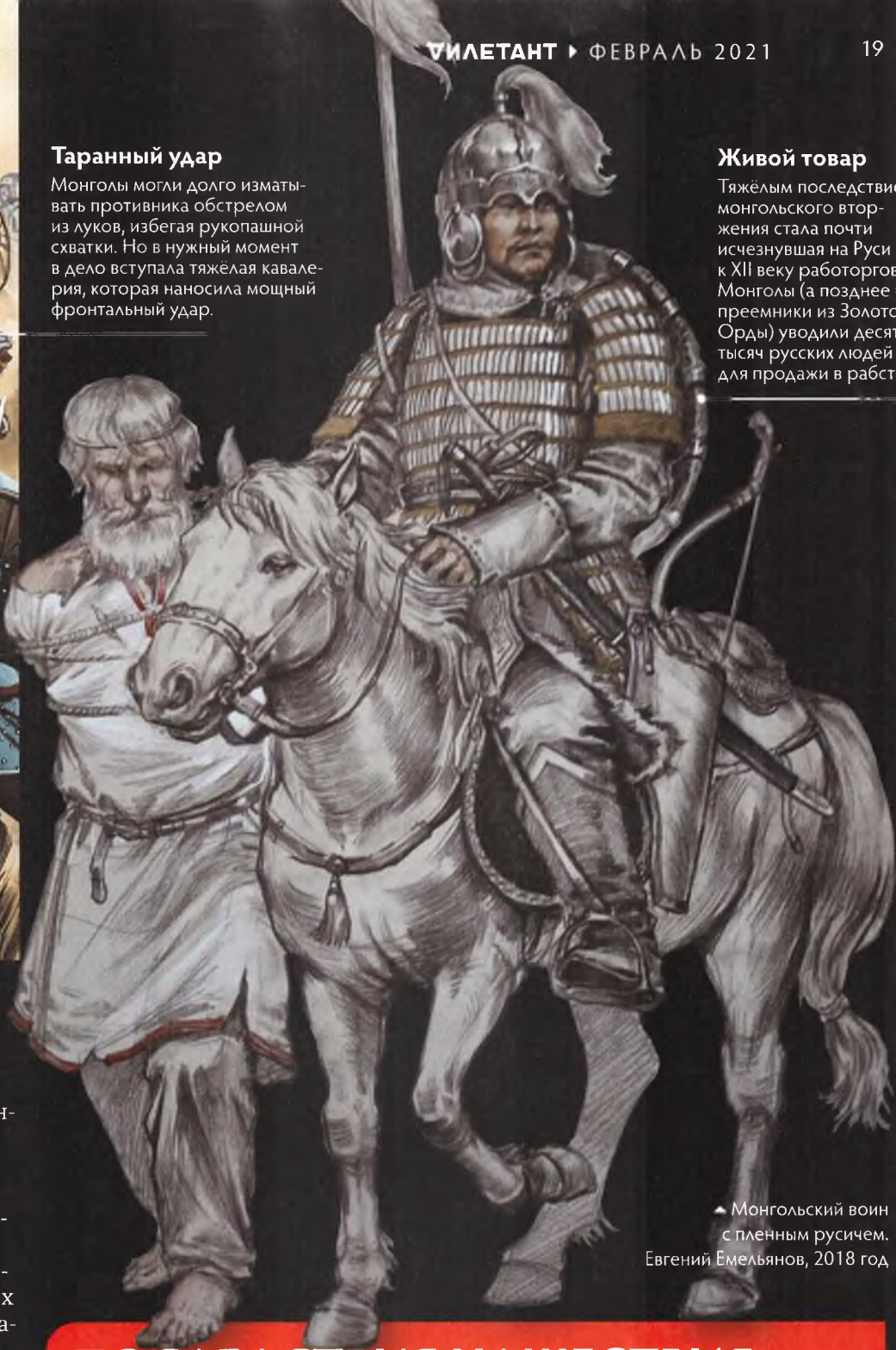
▲ Монгольский воин с пленным русичем. Евгений Емельянов, 2018 год

Сведения о том, как проходила битва за Киев, на удивление скудны и противоречивы. Осада заняла то ли два, то ли три месяца; большинство историков склоняются к тому, что решающий приступ пришёлся на 5 декабря. Монголы сразу ворвались в город, однако установили полный контроль над ним только через сутки, когда захватили детинец и сожгли Десятинную церковь, в которых укрылись последние защитники «матери городов русских».