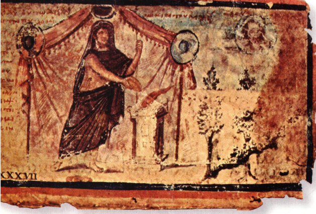
▲ Ахиллес приносит жертву Зевсу. Иллюстрация из «Амброзианской Илиады», пергаментного манускрипта V века

авторов. Их смущали фактические нестыковки в поэмах, отсутствие общей сюжетной линии, использование разных греческих диалектов и стилистические различия между частями одного произведения. Не ставя под сомнение авторство Гомера, они всё же полагали, что отдельные фрагменты текста являются более поздними вставками. Во многих античных изданиях «Илиады» и «Одиссеи» такие отрывки отдельно помечались и выходили с комментариями издателя.