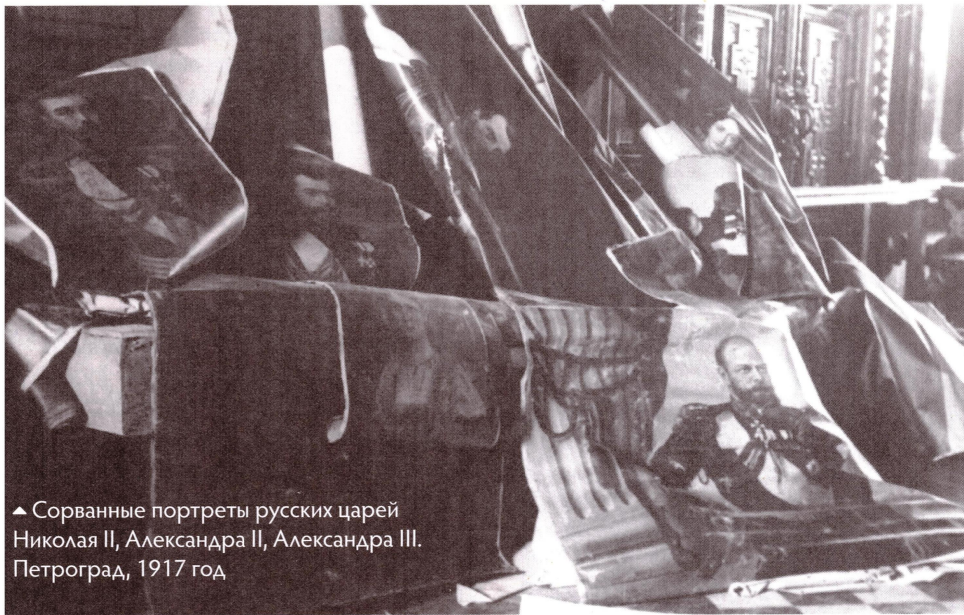
▲ Сорванные портреты русских царей Николая II, Александра II, Александра III. Петроград, 1917 год

Таким образом, суммарно число прямых жертв сталинской социальной политики в 1930–1933 годах превысило 7,5 млн человек.