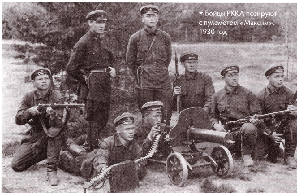
▼ Бойцы РККА позируют с пулемётом «Максим». 1930 год

В 1932-1933 годах сотрудники особых отделов ОГПУ зафиксировали в войсках сотни тысяч (при списочной численности сухопутных сил РККА в 1933 году в 740 тысяч человек) отрицательных высказываний