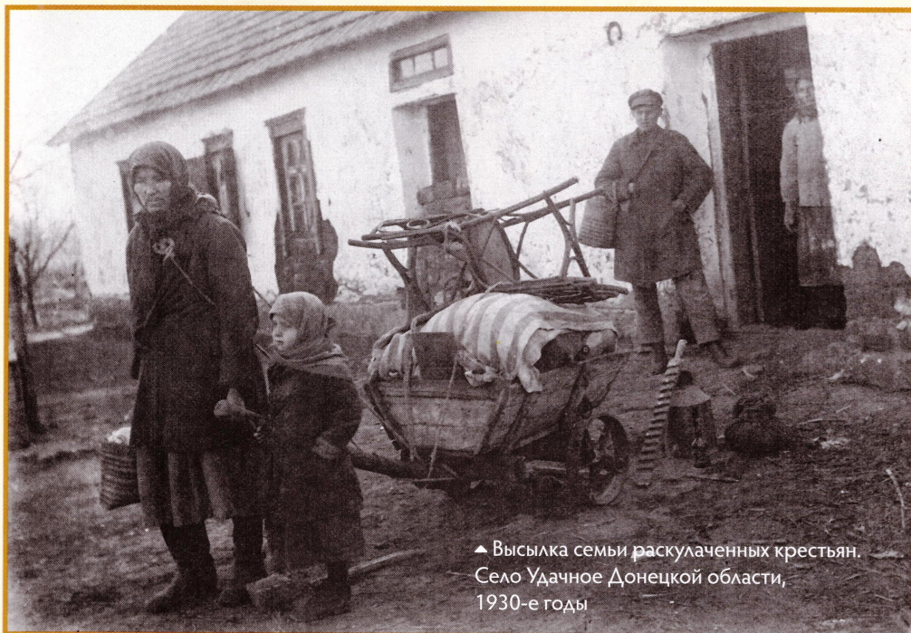
▲ Высылка семьи раскулаченных крестьян. Село Удачное Донецкой области, 1930-е годы