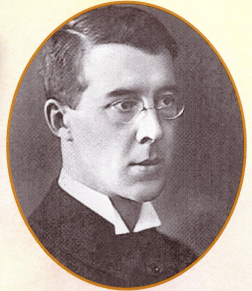
▲ Питирим Сорокин. Фото 1917 года

разрозненной, разобщённой и послушной новым условиям труда.