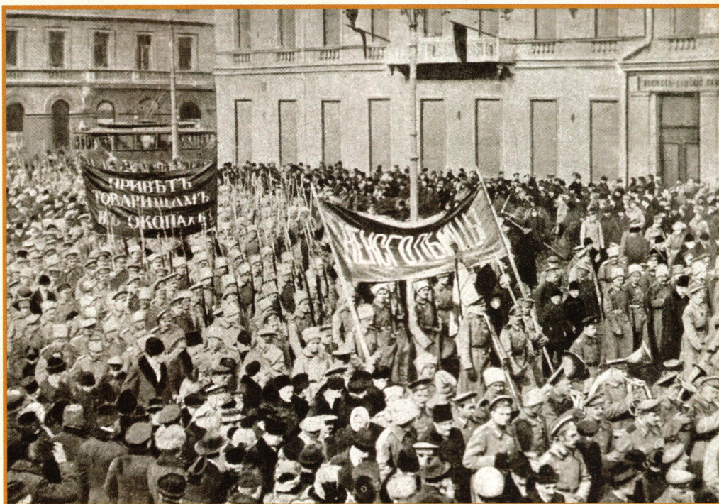
▲ Солдатская демонстрация в Петрограде в февральские дни. 1917 год

Прямым следствием бунта стало крушение конституционно-монархического строя в России. Старый порядок рухнул в первую очередь в результате ошибочных решений, принимавшихся 2-3 марта Николаем II и другими представителями дома Романовых, царствовавшего более трёх веков. В считанные месяцы «великая и бескровная» революция открыла