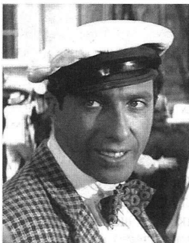
Сергей Юрский и Арчил Гомиашвили в роли Остапа Бендера