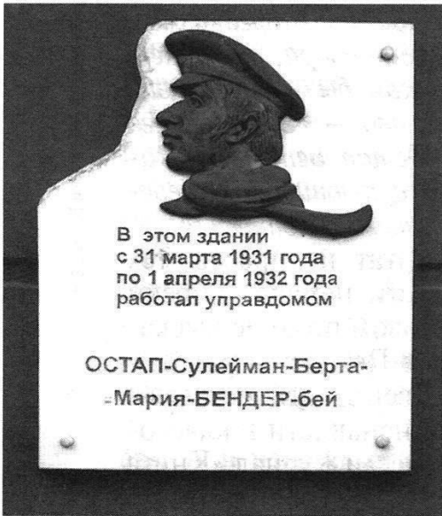
Мемориальная табличка управдому Остапу Бендеру в Одессе, на доме 47 по улице Екатерининской

В этом здании с 31 марта 1931 года по 1 апреля 1932 года работал управдомом