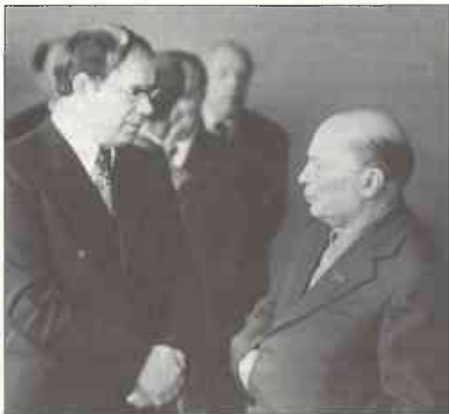
Прыемна паслухаць Аркадзя Куляшова. 1976.

лі партызаны дзяліліся на сваіх і чужых, і тым чужым, прышлым, не было ніякай справы да мясцовых людзей, аднак «найболей за ўсё яму стала шкада Верамеек, знявечаных і загнаных пад зямлю».