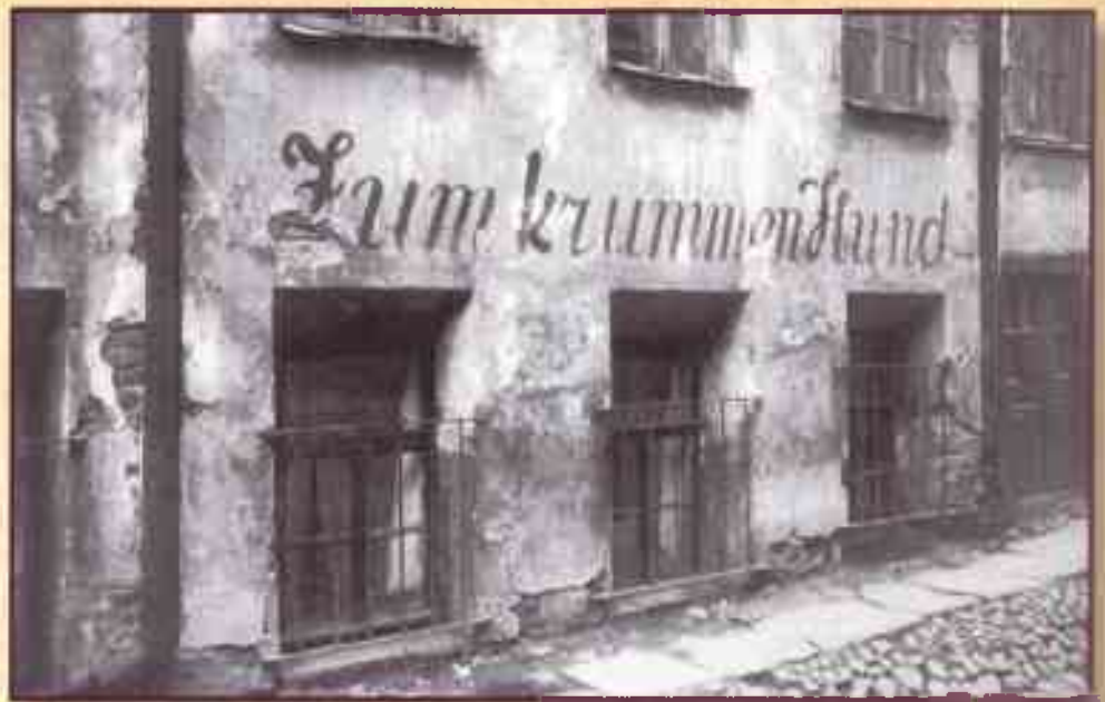
▲ Харчевня «У хромой собаки» (Zum Krummen Hund) у Проломных ворот в Москве. Зарядье, Псковский переулок, 1910-е годы

Корреспондент газеты «День» в середине 1860-х описывал жизнь евреев в самом сердце Москвы: «У нас на самом деле существует «китайская стена», окружающая наше московское гетто — Зарядье. Здесь скромно приютилась в тесных, серых, грязных помещениях большая