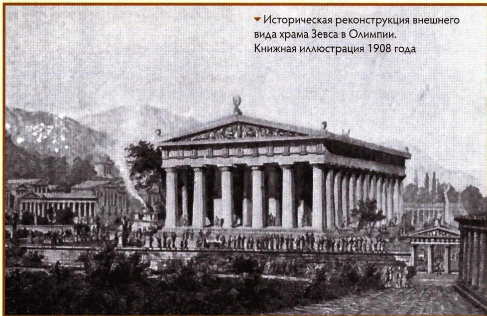
▼ Историческая реконструкция внешнего вида храма Зевса в Олимпии. Книжная иллюстрация 1908 года

А что статуя? Её, скорее всего, просто растащили или разобрали. Впрочем, не факт. Упоминание о ней можно найти в сочинении византийского историка, монаха Георгия Кедрина. Он пишет, что статую перевезли в Константинополь, где она и встретила свою погибель, сгорев во время пожара в 475 году нашей эры. Сам Кедрин жил много позже — в XI–XII веках. На каких источниках основано его утверждение, не вполне понятно. ▾